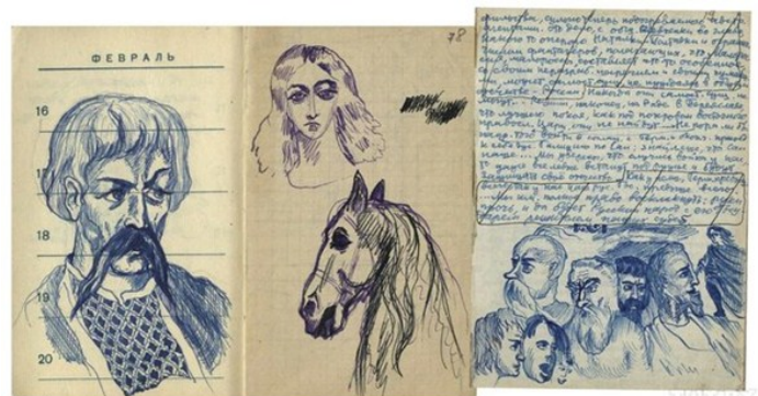
Малюнкi У. Караткевіча

Факт 10. Не любіў, калі яго называлі рамантыкам