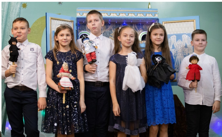
Участники батлеечного театра

По окончании программы учащиеся 7 «А» класса вместе с участниками программы исполнили песню «На Рождество».