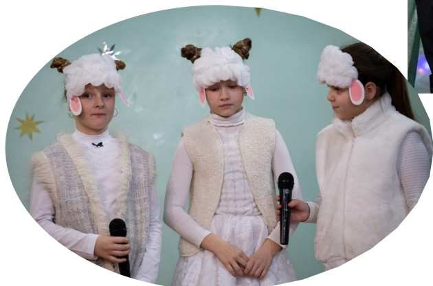
Сказка «Непослушная овечка»