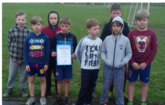
Участники районных соревнований по футболу

♦ Учащиеся 3-4 классов приняли участие в районном соревновании «Малые олимпийские игры» и заняли I место. Команду подгото-