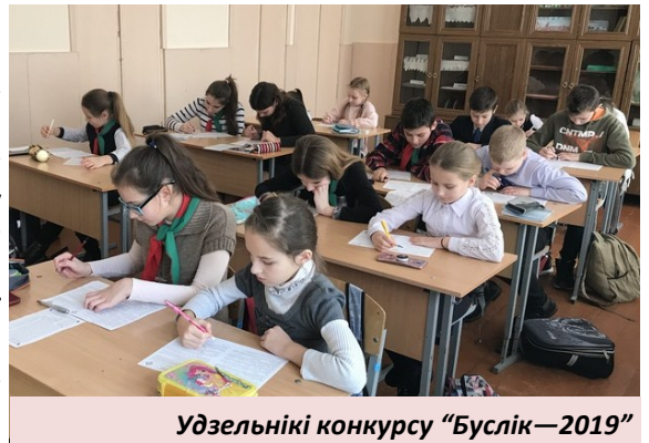
Удзельнікі конкурсу "Буслік—2019"

У лютым у свеце адзначаюць Міжнародны дзень роднай мовы. Для нашага народа такой спрадзеву з'яўляецца беларуская. Яна прайшла доўгі шлях, на якім былі як часы росквіту, так і заняпаду. Выпадалі нават такія перыяды, калі беларуская мова ледзь не знікла, аднак, нягледзячы на ўсе перашкоды, вытрымала выпрабаванні і цяпер займае сваё пачэснае месца сярод іншых моў свету.