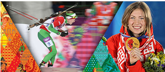
Алімпійская чэмпіёнка Дар'я Домрчава

Многія беларусы сёння працуюць і вучацца за мяжой. Яны заняты кожны ў сваёй сферы, жывуць у розных краінах, заводзяць сяброў і сям'ю, але пры гэтым не забываюць пра сваю