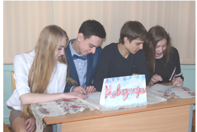
Турнір «Аматыры беларускага слова»

Вызваў цікавасць сярод вучняў 10-11 класаў і інтэлектуальны турнір “Аматыры беларускага слова”, які праводзіла