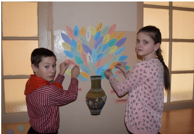
Букет «Родныя словы»

21 лютага прайшла акцыя “Родныя словы”, падчас якой і вучні, і настаўнікі запісвалі на пялёстках свае любімыя беларускія словы. У выніку атрымаўся прыгожы букет са слоў. Як высветлілася, любімыя беларускія словы ў нашай школы – каханне, дзякуй, поспех.