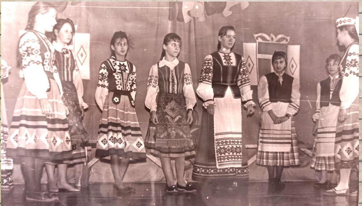
В школе были созданы этнографические коллективы «Батлейка», «Пралеска», «Спадчына».