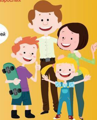
Иллюстрация: Елена Абрамова. Сайт: www.mchs.gov.by © 2014. Оригиналы и оригинальные макеты © МЧС Республики Беларусь. Тираж: 10 000 экз. Минск 2014.

МИНИСТЕРСТВО ПО ЧРЕЗВЫЧАЙНЫМ СИТУАЦИЯМ РЕСПУБЛИКИ БЕЛАРУСЬ