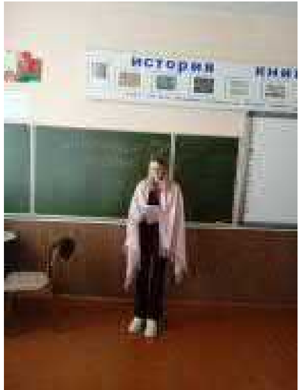
Тренинговое занятие «Распределение бюджета семьи» Беседа «Какие бывают семьи?»