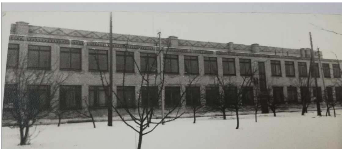
Рыс. 5. Будынак двухпавярховай школы з белай цэглы, 1985 год