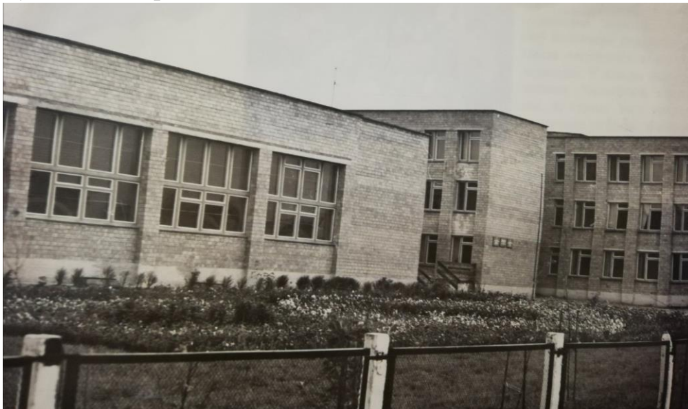
Рыс. 7. Будынак “новай” школы, 1986 год