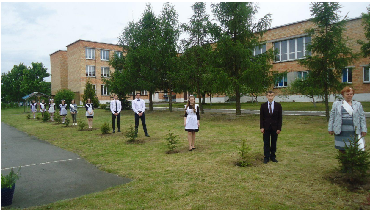
Рыс. 1. Дзяржаўная ўстанова адукацыі “Гоцкі вучэбна-педагагічны комплекс дзіцячы сад – сярэдняя школа Салігорскага раёна”. Выпуск 2019/2020

Дзяржаўная ўстанова адукацыі “Гоцкі вучэбна-педагагічны комплекс дзіцячы сад – сярэдняя школа Салігорскага раёна” знаходзіцца ў аграгарадку Гоцк Салігорскага раёна – у глыбінцы беларускага Палесся, што мяжуе з Лунінецкім раёнам Брэсцкай вобласці і Жыткавіцкім раёнам Гомельскай вобласці.