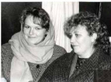
Вечер отдыха пионерских вожатых в Доме пионеров

Финансовую помощь Дому пионеров оказывало Скидельское жилищно – коммунальное хозяйство. Они покупали канцелярские товары, принадлежности для работы кружков, новогодние подарки и подарки для победителей конкурсов.