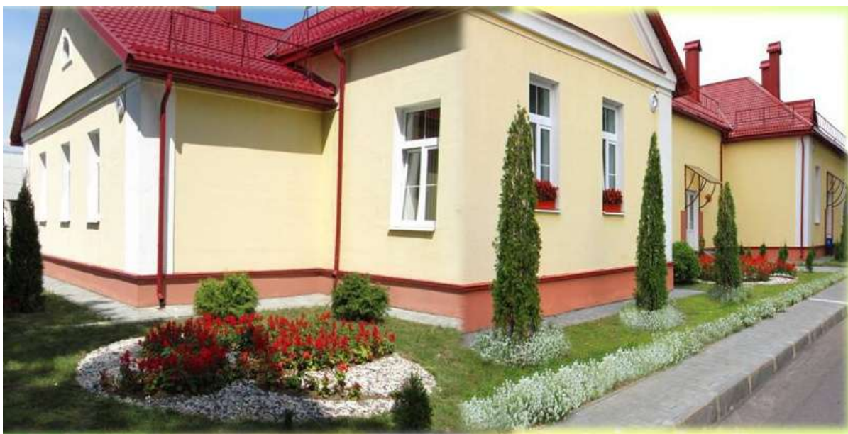
Здание центра по месту жительства г. Скиделя

Учреждение в г. Скиделе стало именоваться филиалом центра внешкольной работы «Центр по месту жительства г. Скиделя». С 2008 по 2012 год оно было капитально отремонтировано. Сегодня – это современное учреждение для работы с детьми и молодежью по месту жительства с необходимым музыкальным и световым оснащением.