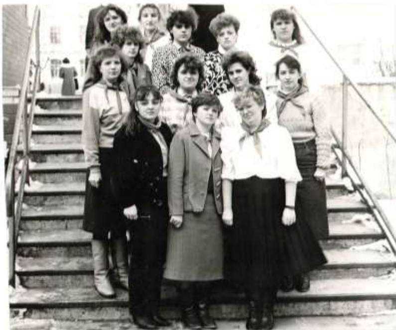
Участники районного семинара, 1991 год

Финансовую помощь Дому пионеров оказывало Скидельское жилищно – коммунальное хозяйство. Они покупали канцелярские товары, принадлежности для работы кружков, новогодние подарки и подарки для победителей конкурсов.