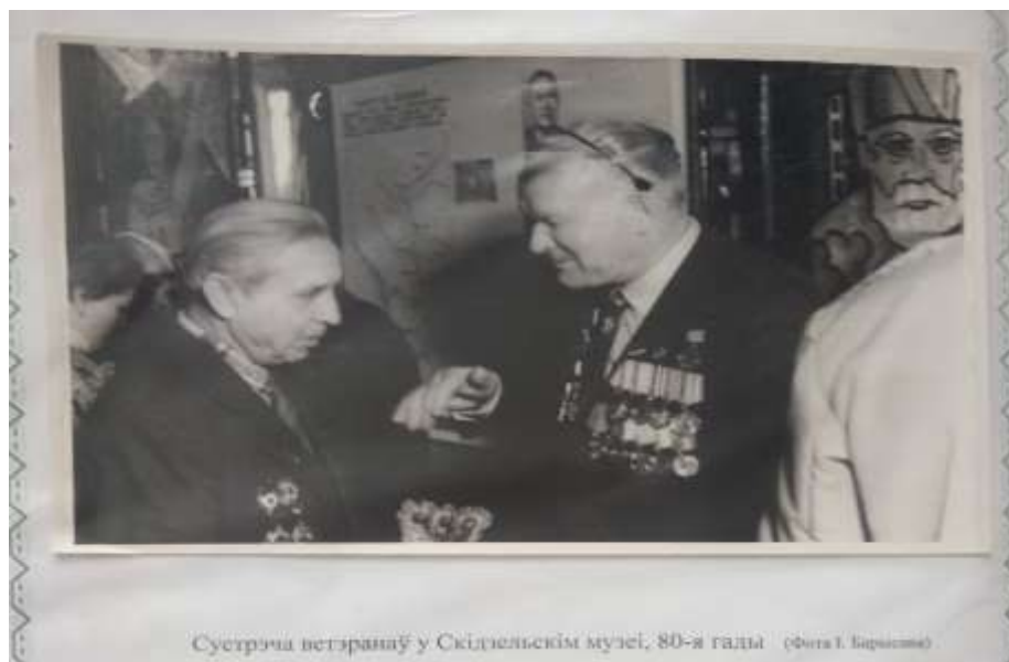
Сустрэча ветэранаў у Скідэльскім музеі, 80-я гады

Музей стал центром встречи детей и молодежи с ветеранами Великой Отечественной войны.