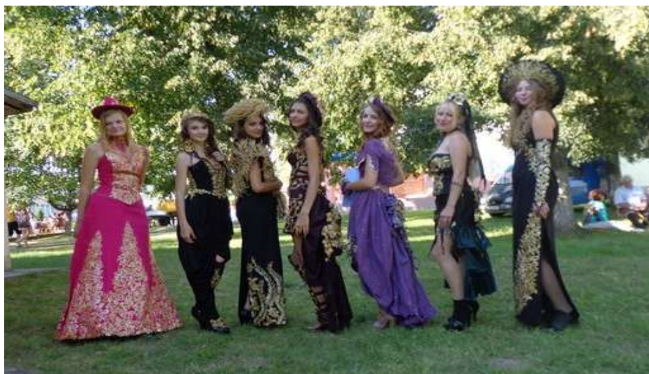
Народный театр моды «Купава»

Звание «образцовый» имеет также театр моды «Купава».