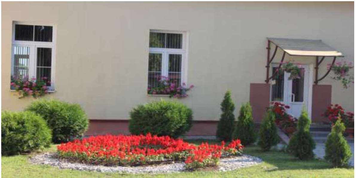
Здание центра по месту жительства г. Скиделя

В беседе с Рыль Л.В. мы узнали, что работа центра по месту жительства после ремонта наполнилась новым содержанием. Здесь проходили все районные мероприятия с детьми. Открылись новые кружки. Педагогический коллектив проводил городские праздники для учащихся всех школ и их родителей. Она представила статьи из газет, где освещалась деятельность педагогического коллектива.