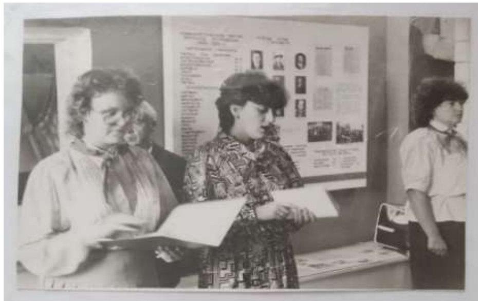
Торжественный прием в пионеры.

В музее принимали учащихся в ряды пионерской и комсомольской организаций.