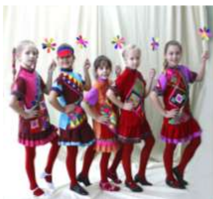
Младшая группа народного Театра моды «Купава»