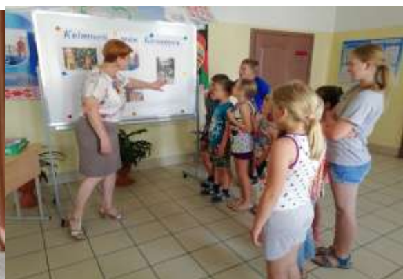
Быль В.Ч. и участники клуба «Патриот»