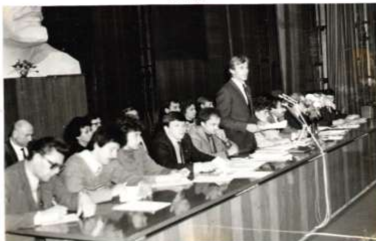
XXI Гродненская Районная комсомольская конференция 1990 год

В 1990 году на базе Дома пионеров проходила XXI Гродненская районная комсомольская конференция.