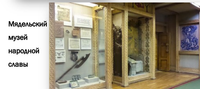
Мядельский музей народной славы