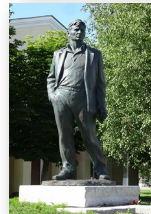
Памятник Максиму Танку