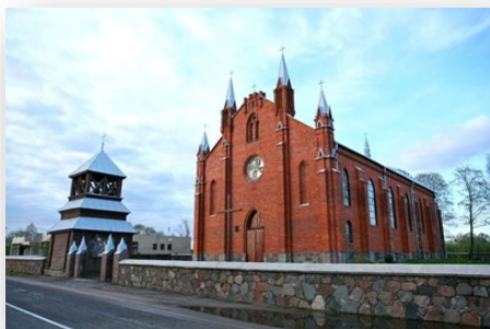
Костел Святого Апостола Андрея