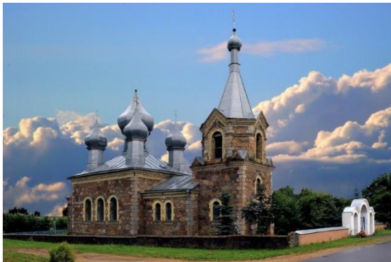
3. Церковь Святого Николая Чудотворца аг.Старые Габы