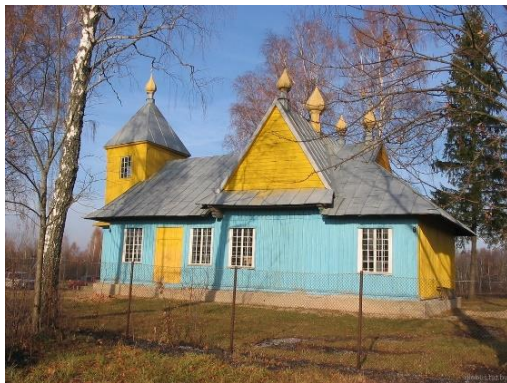
5. Свято-Троицкая церковь д.Некасецк