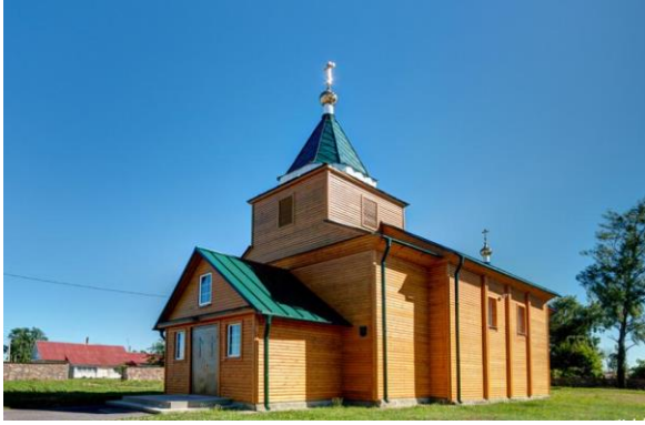
1. Свято-Троицкая церковь аг.Княгинин