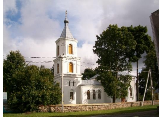
2. Свято-Троицкая церковь г.п.Кривичи