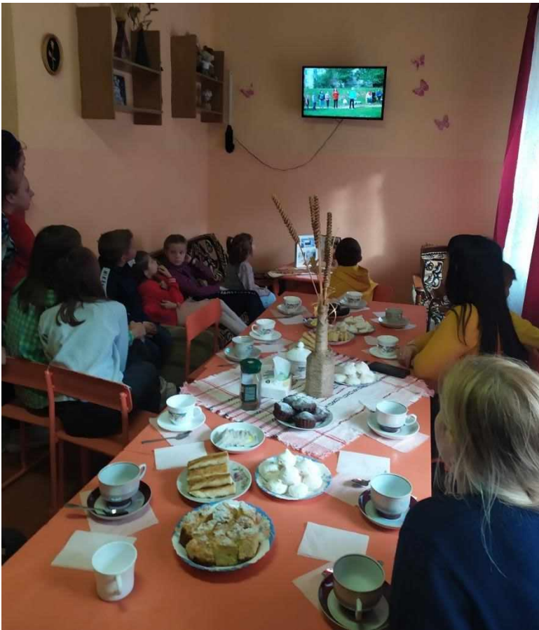
Организация чаепития для учащихся «За чаем не скучаем»