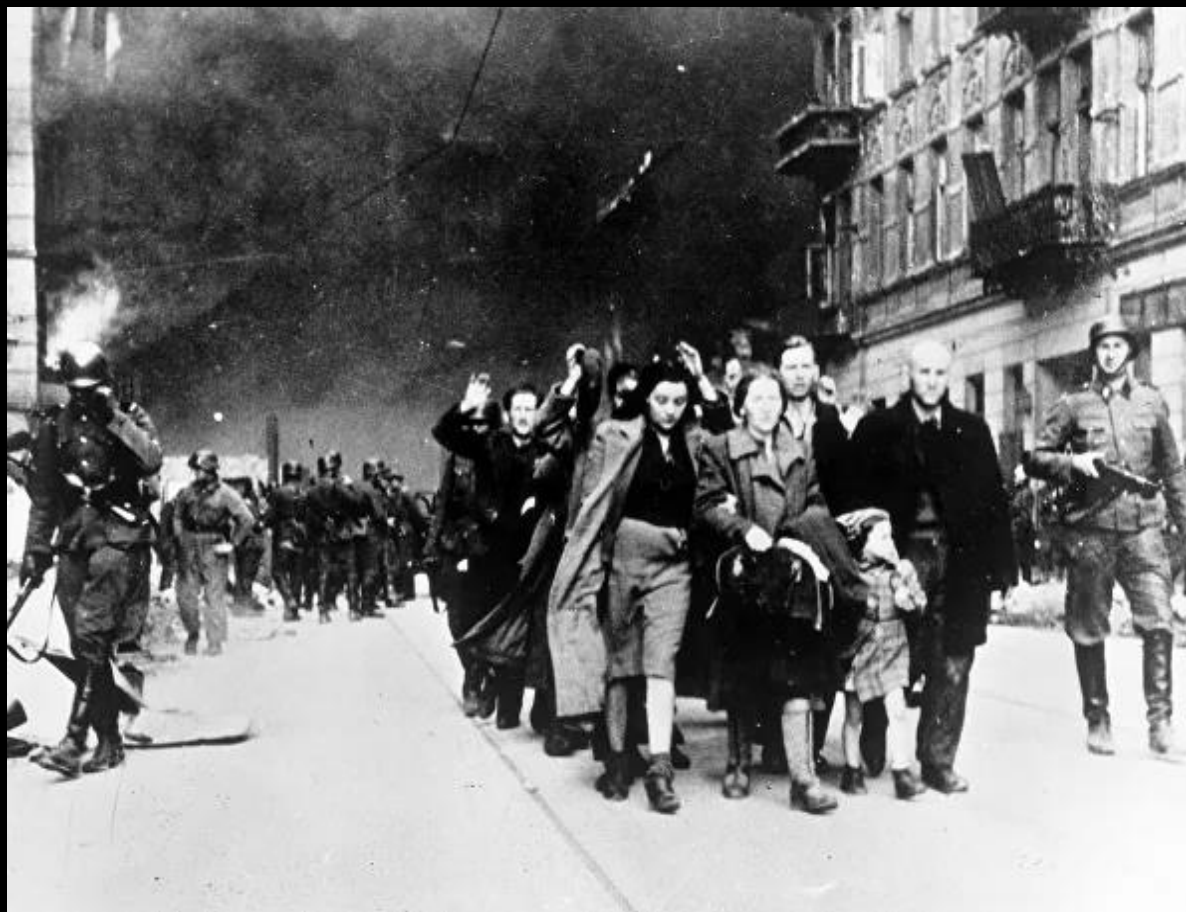
Жителей Варшавского гетто отправляют в лагерь смерти Трешлинка. 1942 год