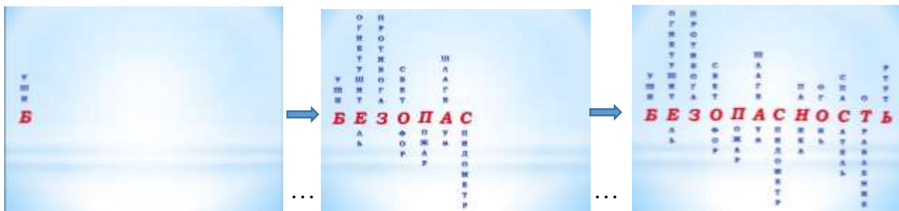
Слайд 2 (Каждый правильный ответ отображается на экране)

Ведущий: И сейчас я предлагаю вам вместе определить тему нашего собрания. Внимание на экран. Прошу вас ответить на вопросы. Правильные ответы будут появляться на экране. И в итоге в горизонтальной строке откроется ключевое, главное слово нашей сегодняшней встречи.