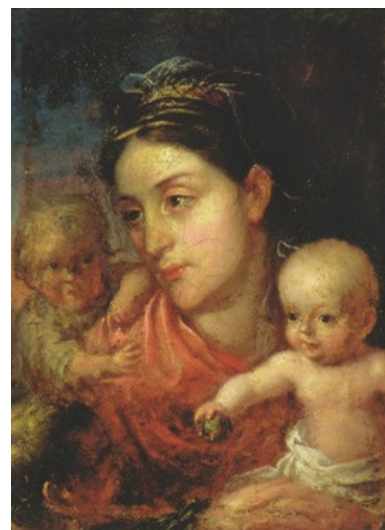
Партрэт жонкі мастака з дзецьмі