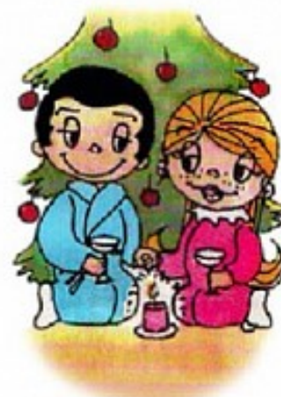
заўсёды цікавыя мерапрыемствы

Першы дзень тыдня прайшоў пад дэвізам "Не проста ў словы я гуляю - на мове роднай размаўляю" і быў прысвечаны Міжнароднаму дню роднай мовы. Вучняў 2 «А» класа паклікаў на сустрэчу любімы шматлікімі дзецьмі часопіс "Вясёлка", старонкі якога рабяты з задавальненнем чыталі. У гэты дзень у час правядзення літаратурнай гасцёўні «Слова наша роднае» у 4 «В» класе і конкурсу чытальнікаў ў 4 «А» класе гучалі лепшыя паэтычныя і празаічныя радкі, прысвечаныя роднай мове, культуры і гісторыі Беларусі.