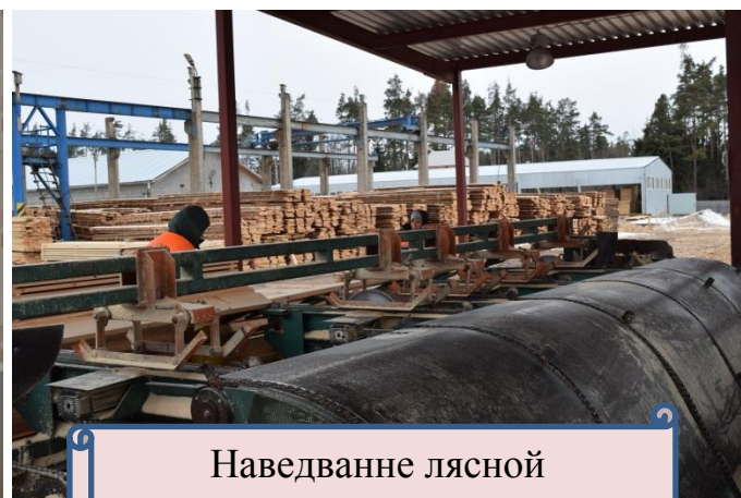
Наведванне лясной гаспадаркі