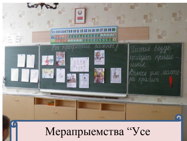
Мерапрыемства “Усе прафесіі важны!”