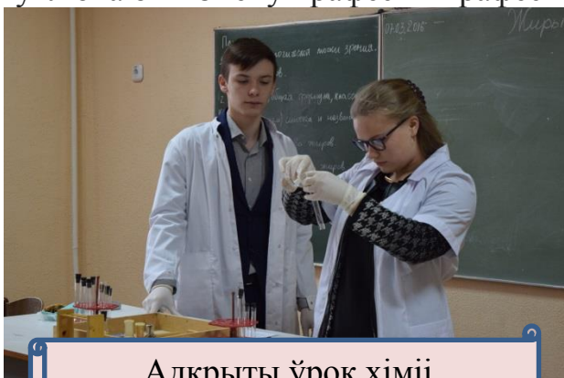
Адкрыты ўрок хіміі

Прафесійнае развіццё асобы і падтрымку прафесійнай кар'еры, уключаючы змену прафесіі і прафесійную перападрыхтоўку.