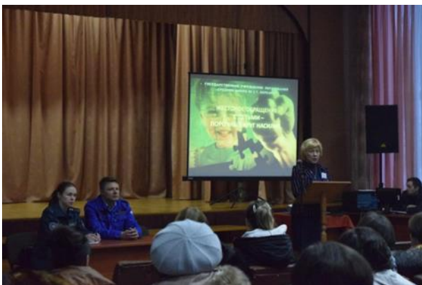
БАЦЬКОЎСКІ СХОД «АТМАСФЕРА ЖЫЦЦЯ СЯМ'І ЯК ФАКТАР ФІЗІЧНАГА, ДУХОЎНАГА І ПСІХІЧНАГА ЗДАРОЎЯ ДЗІЦЯЦІ»