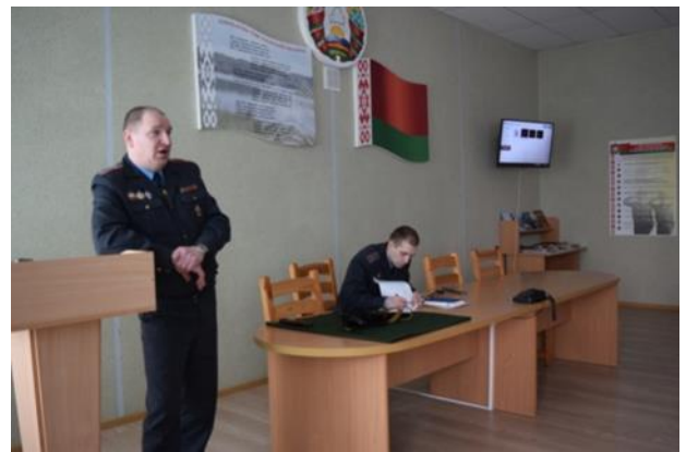
БЯРЭЗІНСКІ РАУС. ДЗЕНЬ АДКРЫТЫХ ДЗВЯРЭЙ