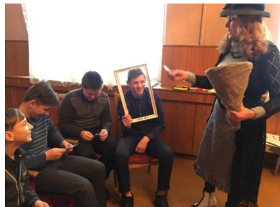
МЕРАПРЫЕМСТВА “СПЯШАЙСЯ ПАКІНУЦЬ У ЖЫЦЦІ ДОБРЫ АДБИТАК”