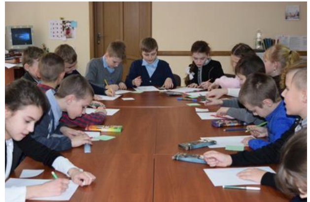
ДЗЕЛАВАЯ ГУЛЬНЯ “МЫ ЖЫВЁМ ПА ЗАКОНЕ”