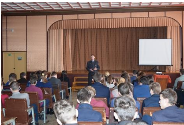
ПРЭС-КАНФЕРЭНЦЫЯ “ПАДЛЕТАК І ЗАКОН”