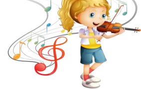
Радзевіч Аліна, 7 "Б". Іграка для матулі на скрыпцы