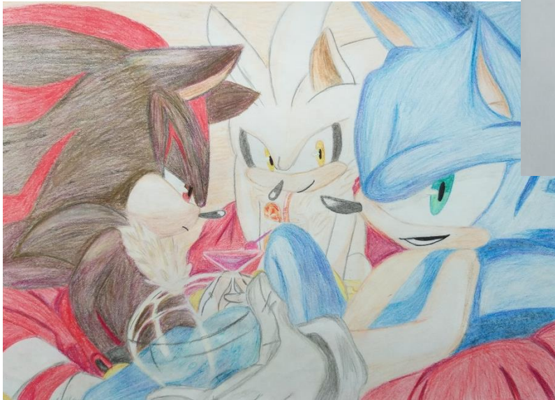
Малюнкi Аліны Васільковай, вучаніцы 9 "Б" класа