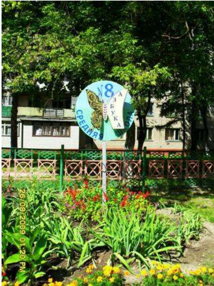
Год за годом школа хорошела, одеваясь в разноцветные наряды.