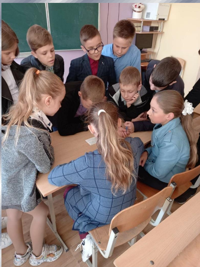
Фото-конкурс «В кадре октябрята и пионеры» Октябрятская группа «СОЛНЫШКО»

Пионеры выполняли различные задания по станциям: разгадывали шифры и кроссворды, отвечали на вопросы викторины, рисовали плакаты, проходили спортивные задания и многое другое.