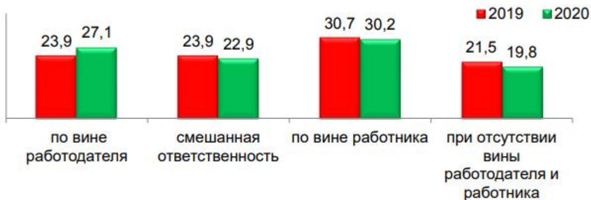
Рис.4 Распределение ответственности по случаям со смертельным исходом, %

Детализация причин производственного травматизма свидетельствует о том, что в 2020 году по сравнению с 2019 годом они по своему характеру существенно не изменились (таблица 4). Преобладающими по-прежнему остаются нарушения требований нормативных правовых актов, технических нормативных правовых актов, локальных правовых актов по охране труда и невыполнение руководителями и специалистами обязанностей по охране труда.