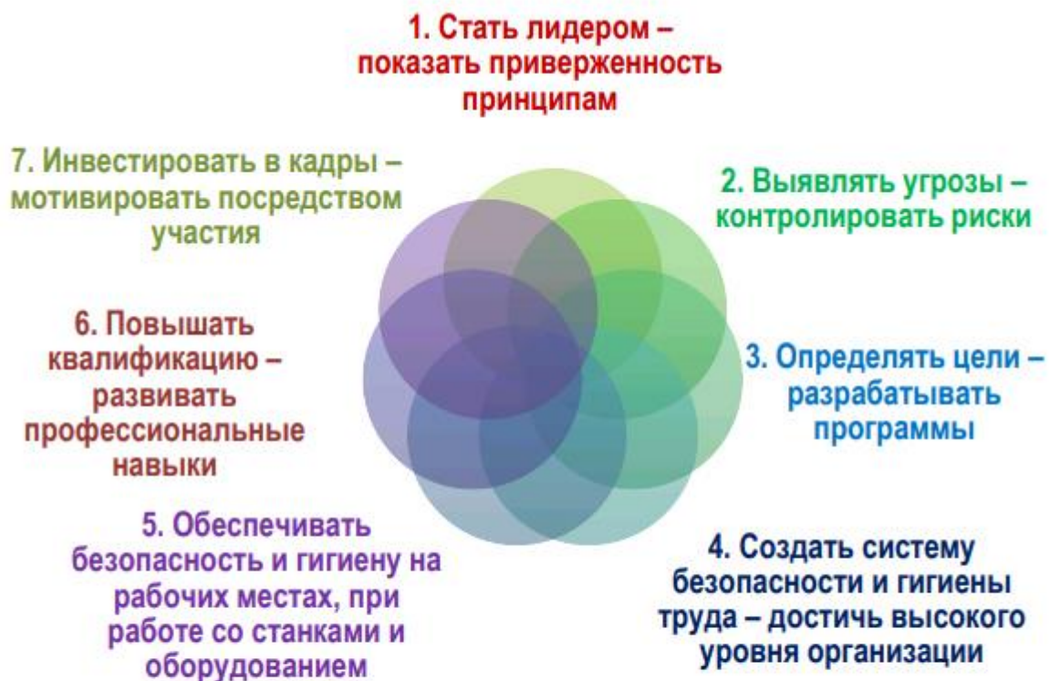
Рис.5 Семь золотых правил Концепции «Нулевого травматизма» (Vision Zero)

Использование положительного международного опыта в вопросах охраны труда несет в себе большой потенциал. Существенный положительный вклад в продвижение вопросов охраны труда вносит применение в организациях нашей страны принципов Концепции «Нулевого травматизма», разработанной Международной ассоциацией социального обеспечения (МАСО).