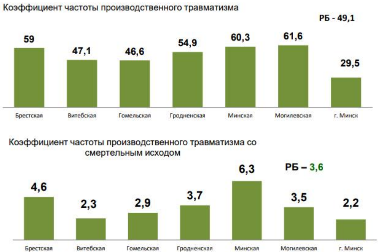
Рис.2 Коэффициенты частоты производственного травматизма в разрезе регионов за 2020 год, случаев на 100 тыс. застрахованных.

Коэффициент частоты производственного травматизма (численность потерпевших на производстве в расчете на 100 тысяч застрахованных по обязательному страхованию от несчастных случаев на производстве и профессиональных заболеваний) в 2020 году составил 49,1 (в 2019 году – 51,8), коэффициент частоты смертельного травмирования, как и в 2019 году составил 3,6. Коэффициента частоты производственного травматизма в разрезе регионов представлены на рисунке 2.