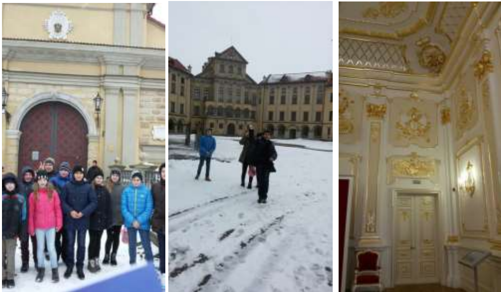
Национальный историко-культурный музей-заповедник «Несвиж»