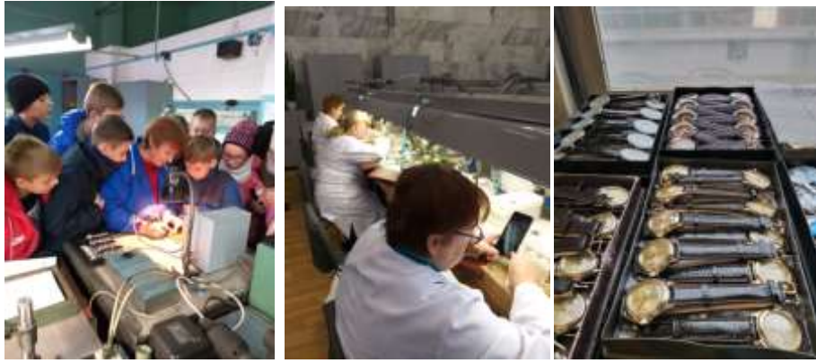
«Минский часовой завод «Луч»