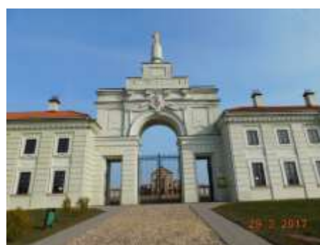
Ружанский дворцовый комплекс рода Сапег