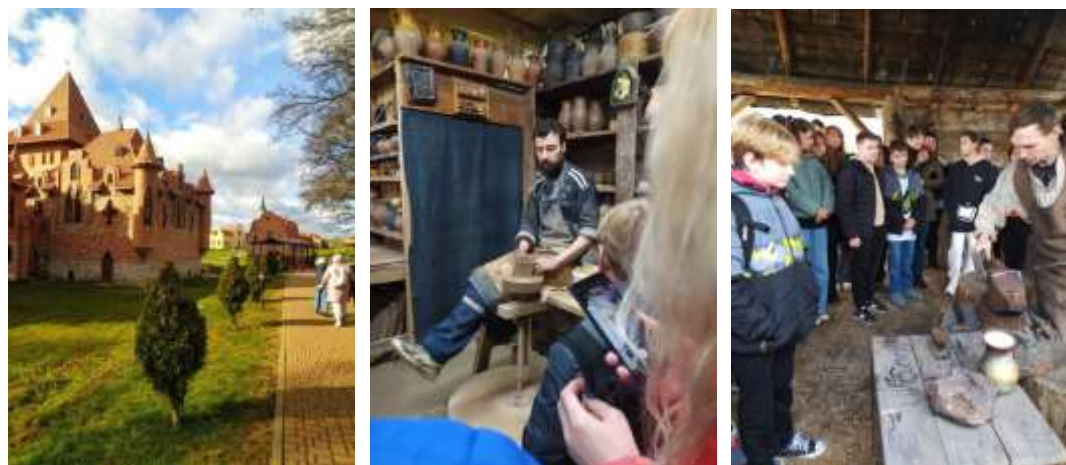
Парк гісторыі “Вялікае Княства Сула”