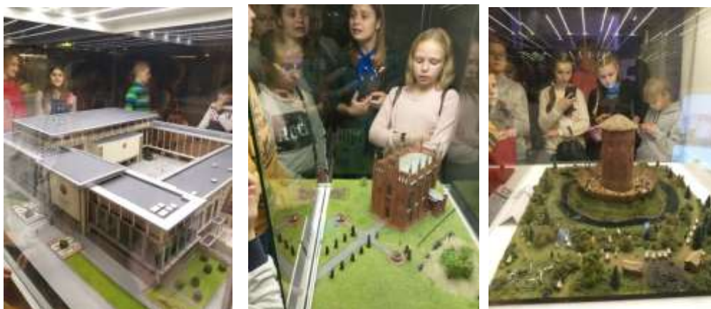
Музей «Беларусь-мини» (г. Минск)