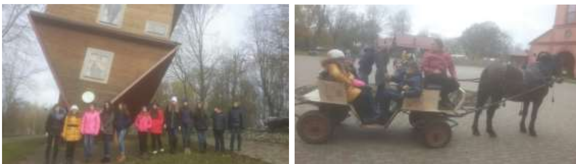
Дукорский маёнтак (д.Дукора)