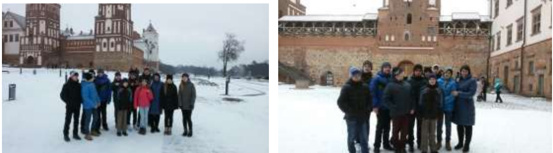
Замковый комплекс «Мир»