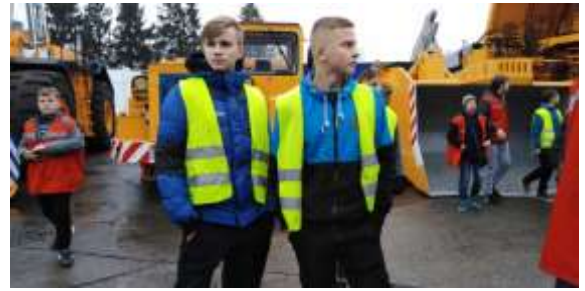
ОАО «БЕЛАЗ» г. Жодино