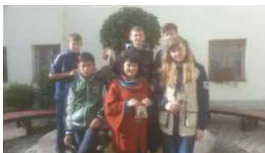
Музей истории религии (г. Гродно)