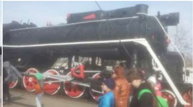
«Музей железнодорожной техники» г. Брест