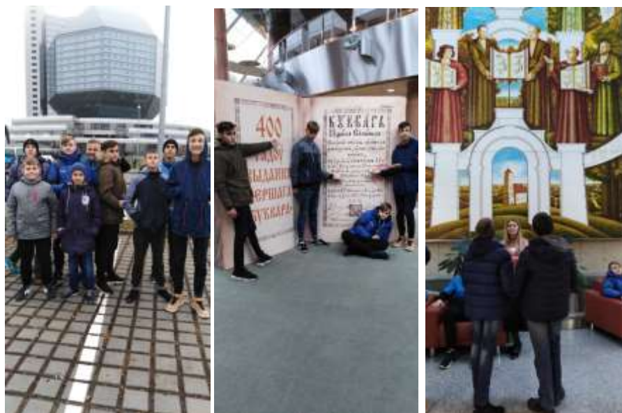
Национальная библиотека Республики Беларусь (г. Минск)