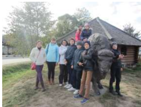
Гарадзенскі маёнтак “Каробчыцы”