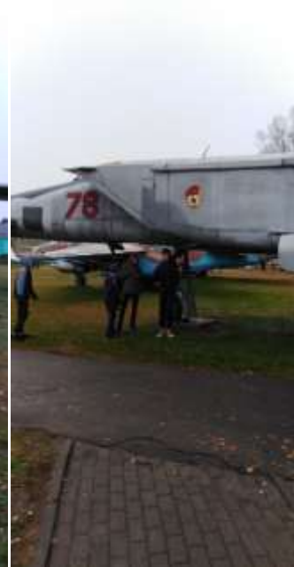
«Музей под открытым небом авиационной техники» д. Боровая