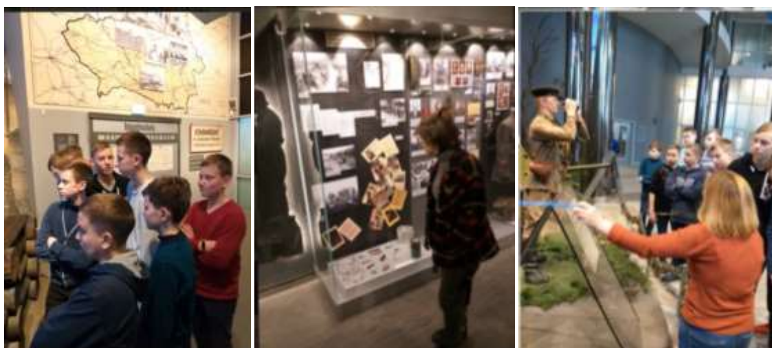
«Белорусский государственный музей истории Великой Отечественной войны» (г. Минск)