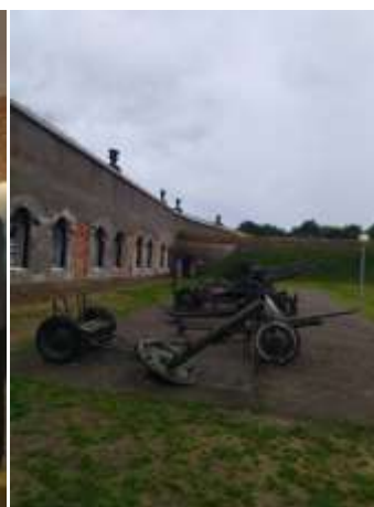
Мемориальный комплекс «Брестская крепость – герой»