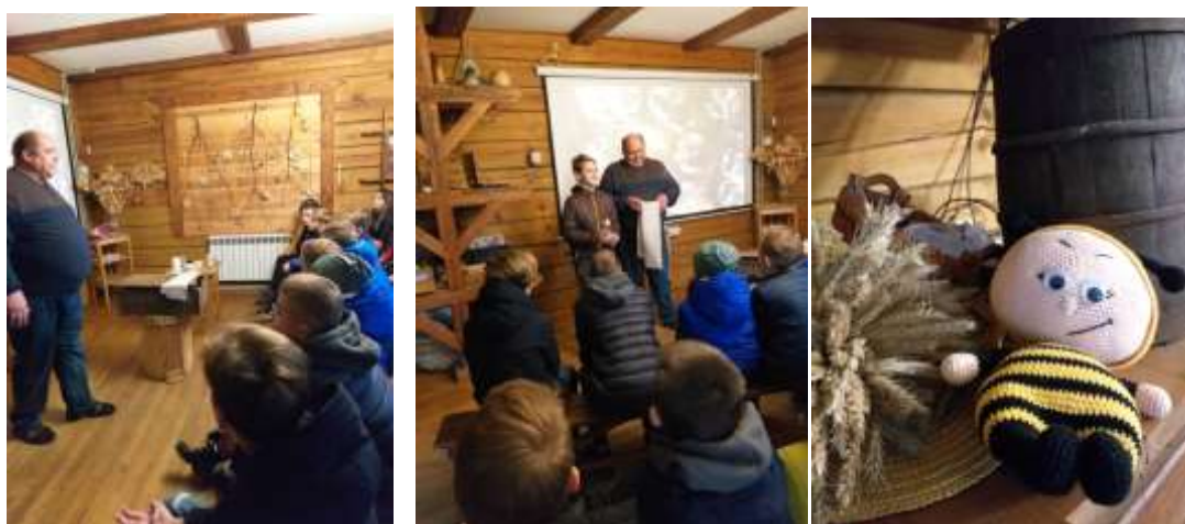
Музей-усадьба «Старая Весь» (д. Вороничи Гродненской обл.)