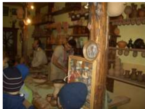
Музейный комплекс старинных народных ремесел и технологий «Дудutki»