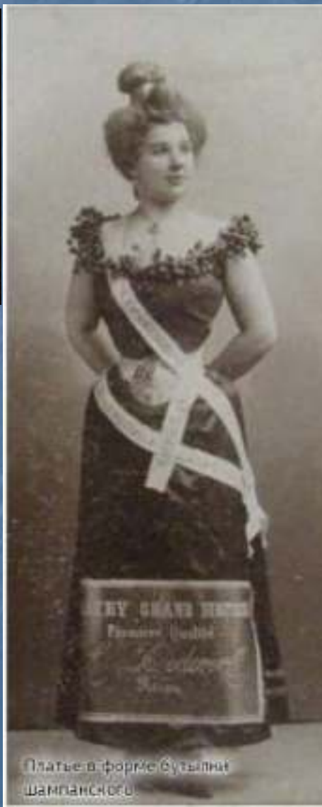
Платье в форме бутылки шампанского.