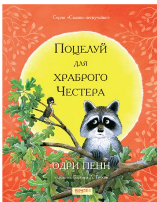
Одри Пенн «Поцелуй для храброго Честера»