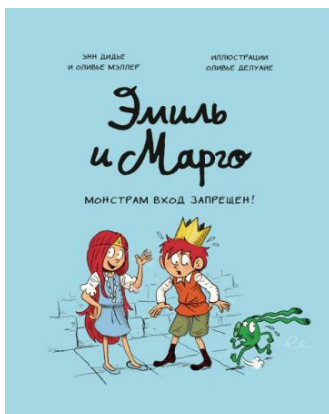
Дидье, Меллер «Эмиль и Марго. Монстрам вход запрещен»