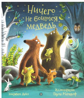
Дейл Элизабет «Ничего не боится медведь»