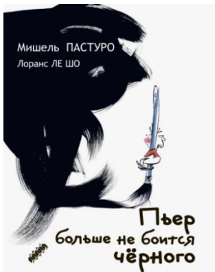
Мишель Пастуро «Пьер больше не боится черного»