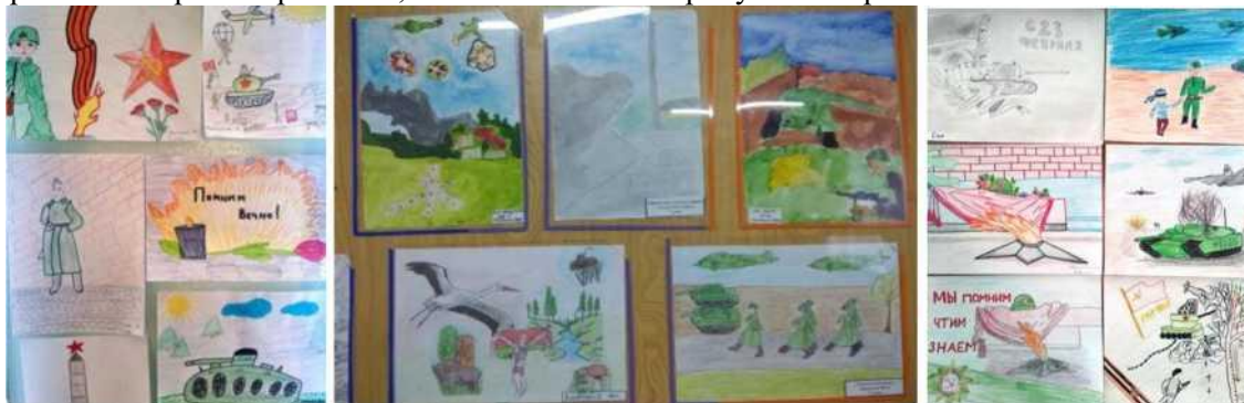
Фото 1, 2, 3. Выставка детских рисунков

Для формирования нравственного уклада школьной жизни, создания соответствующей среды развития, основанной на национальных ценностях и традициях, духовных идеалах, была выработана четкая система проведения как классных, так и общешкольных мероприятий патриотической направленности. Традиционно проводим Недели народного единства, гражданственности, Государственного герба и флага Республики Беларусь. Это отличная возможность вспомнить наше историческое и культурное наследие, белорусские традиции, лучшие качества белорусского народа. Обязательным мероприятием при проведении этих Недель является выставка детских рисунков. Ведь пока ребенок творчески работает, он осмысливает и пропускает через себя те или иные события.