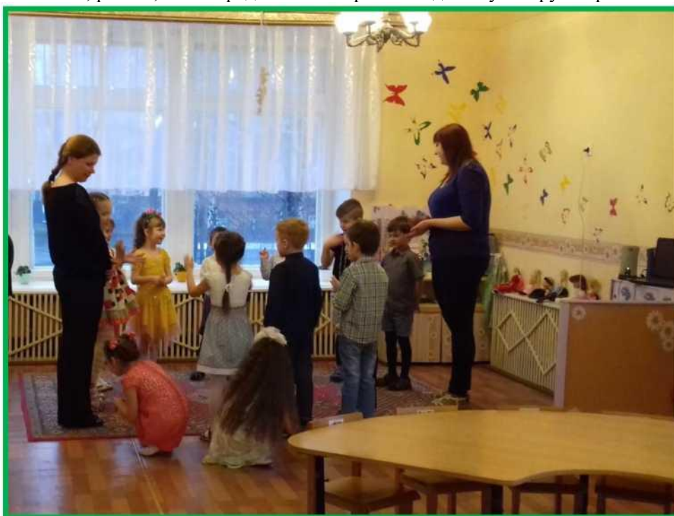
Рисунок 3. Подвижная игра «Гарлачык»

В. Сейчас, ребята, я вам предлагаю поиграть в подвижную игру «Гарлачык»