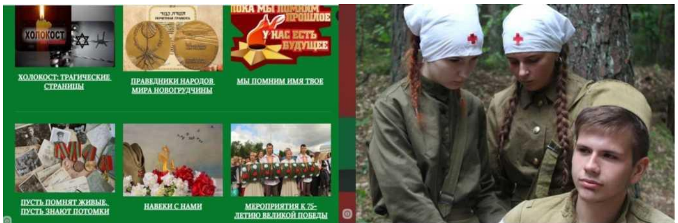
Фото 1-2- Скриншоты страниц виртуального музея

Виртуальный музей содержит в себе собрание разного рода web-страниц, посвященных событиям Второй Мировой войны на территории Новогрудского края.