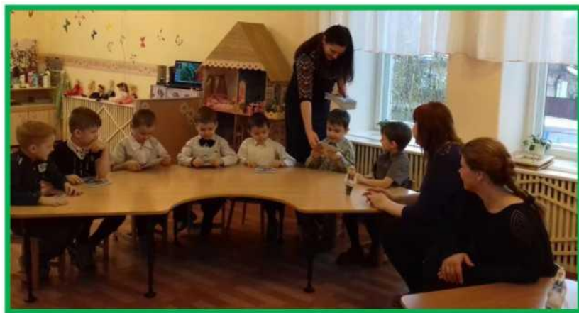
Рисунок 5-6. Подведение итогов, награждение