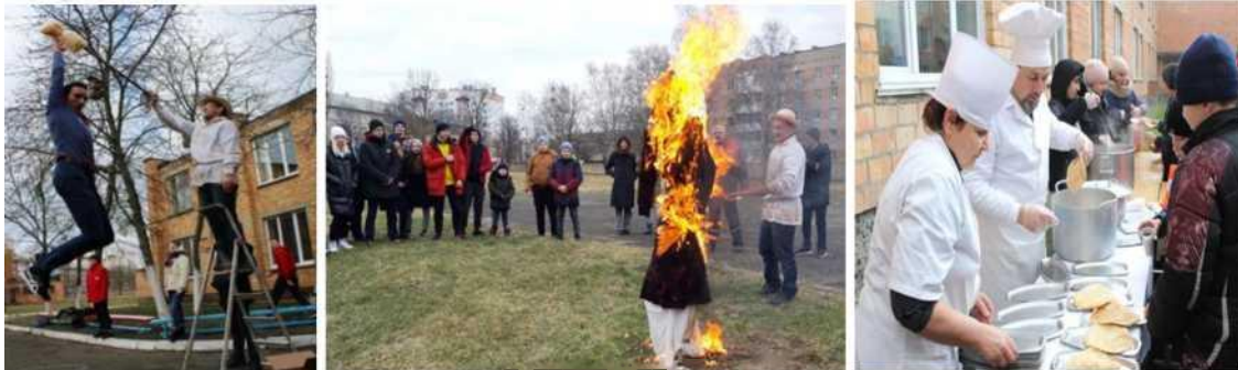
Фото 6. Масленица на школьном дворе

каната. И конечно же, главный обряд Масленицы - сжигание Чучела Зимы! А в завершении ребята лакомятся традиционными угощениями - блинами, и запивают ароматным чаем.