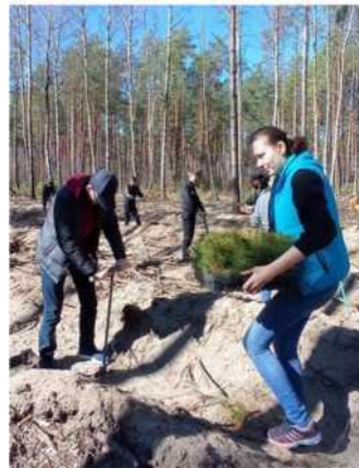
Фото 9. Посадка леса

Все проводимые мероприятия должны естественно и гармонично пополнять детское содержание, раскрывать новые, ранее неизвестные или непонятные стороны окружающей действительности. Задачи воспитания подрастающего поколения значительно расширились, акценты переместились в область патриотического и духовно-нравственного воспитания. Поэтому воспитание гражданина и патриота находится в центре формирования образовательного пространства учреждения образования.