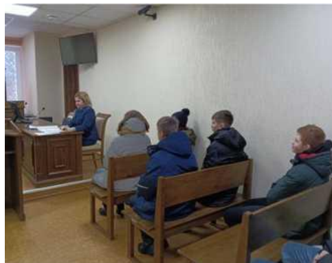
Фото 9. Посещение заседания суда

При ознакомлении детей с трудом взрослых важно руководствоваться принципом перехода от простого, близкого к более далёкому, сложному (труд педагогов, родителей, людей в ближайшем окружении, характерные виды труда людей города).