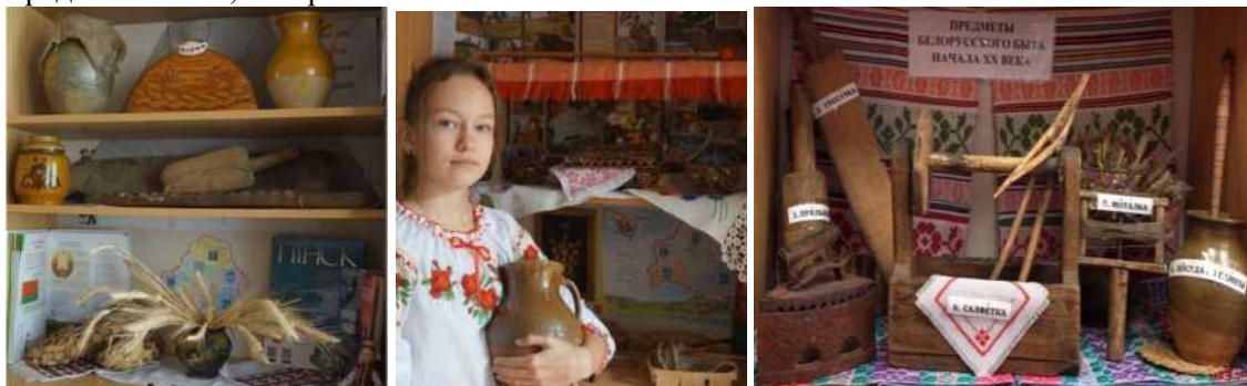
Фото 5. Белорусский национальный уголок

Для приобщения детей к белорусской культуре и истории в каждом классе создана особая развивающая предметно-пространственная среда, которая способствует целенаправленному формированию патриотических качеств личности обучающихся. Это белорусские национальные уголки. Здесь размещены предметы декоративно-прикладного искусства: тканые и вышитые изделия: скатерти, рушники; керамика: миски, кувшины; изделия из соломы, лозы; белорусские народные игрушки. И обязательно государственная символика. Особую ценность эти уголки приобретают, когда создаются усилиями самих детей при содействии педагогов. Ребята с трепетом рассказывают о своих экспонатах, знают их предназначение, историю появления.