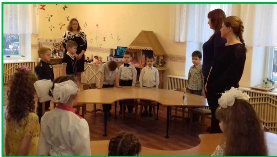
Рисунок 5. Конкурс капитанов

В. Наша викторина подходит к концу, вы справились со всеми заданиями и я попрошу наше уважаемое жюри подвести итоги.