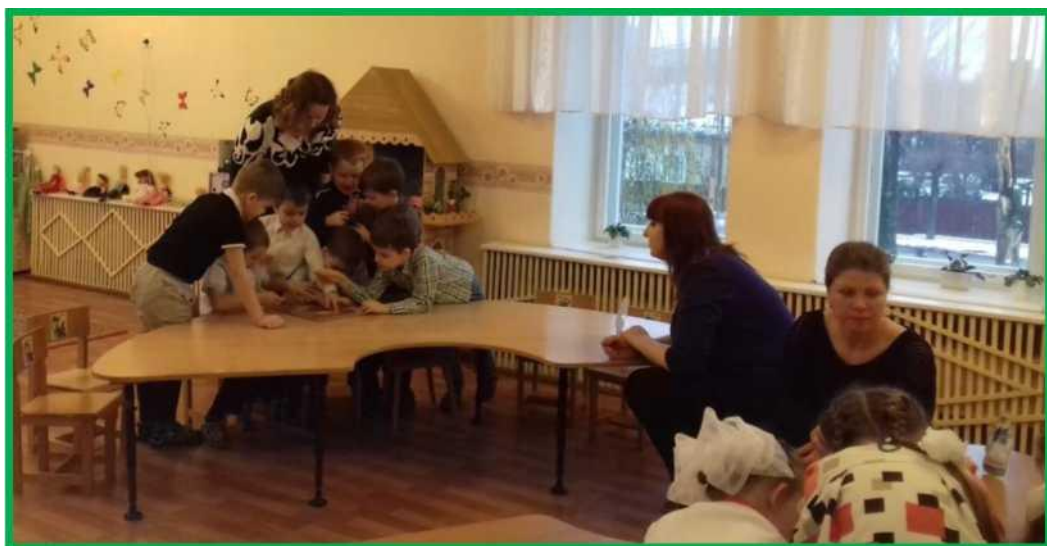
Рисунок 4. Конкурс «Кто быстрее соберет карту Беларуси».