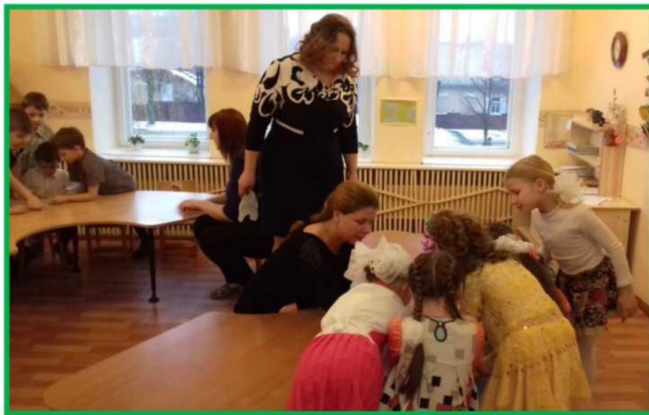
Рисунок 1. Дети собирают картинки, на которых изображены мальчик и девочка в белорусских национальных костюмах.

В. А чтобы узнать, как будут называться ваши команды, я вам предлагаю собрать пазл.