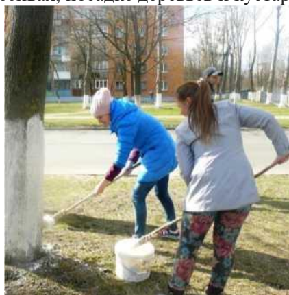
Фото 7. Благоустройство города Все проводимые мероприятия

Формирование любви к Родине через любовь к природе - одно из средств воспитания патриота. Целью является формирование у детей потребности совершать добрые дела и поступки, беречь и охранять природу родного края. Поэтому всегда активно участвуем в трудовых делах по уборке и благоустройству не только школьного двора, но и мест отдыха в парках и скверах, лесных массивах, посадке деревьев и кустарников.