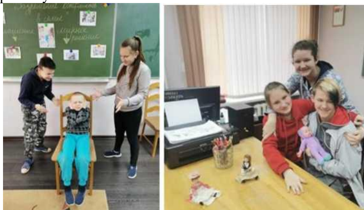
Фото 6, 7. Занятие с ролевыми играми

Занятия в форме игры - одни из самых любимых видов занятий. Они интересны учащимся, приносят им радость, потому что в ходе таких мероприятий дети действуют непосредственно, свободно. Ценность их заключается и в том, что знания, полученные в процессе таких игровых упражнений, легко переносятся детьми в реальную жизнь.