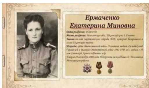
Рисунок 1. Фрагмент страницы фронтового

Например, на уроке «Наш край» учащиеся готовят сообщения, презентации о жизненном пути родственников, которые принимали участие в Великой