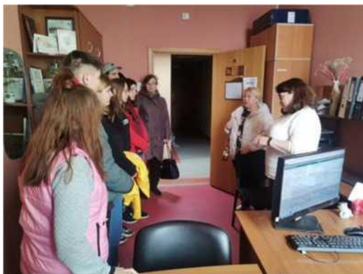
Фото 8. Посещение нотариальной конторы