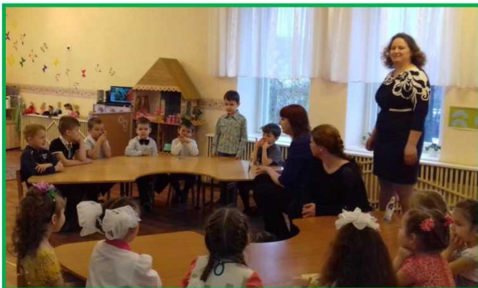
Рисунок 2. Команды отвечают на вопросы.

В. Сейчас, ребята, я вам предлагаю поиграть в подвижную игру «Гарлачык»