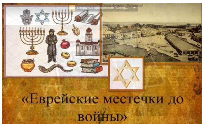
Фото 3 - Презентация "Моя малая родина: еврейские местечки до войны"

Учащиеся создали презентацию "Праведники народов мира Новогрудчины", приняли участие в мероприятии, посвященном Дню памяти жертв Холокоста.