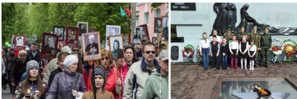
Фото 4. Мероприятия ко Дню Победы

Для приобщения детей к белорусской культуре и истории в каждом классе создана особая развивающая предметно-пространственная среда, которая способствует целенаправленному формированию патриотических качеств личности обучающихся. Это белорусские национальные уголки. Здесь размещены предметы декоративно-прикладного искусства: тканые и вышитые изделия: скатерти, рушники; керамика: миски, кувшины; изделия из соломы, лозы; белорусские народные игрушки. И обязательно государственная символика. Особую ценность эти уголки приобретают, когда создаются усилиями самих детей при содействии педагогов. Ребята с трепетом рассказывают о своих экспонатах, знают их предназначение, историю появления.