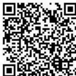
Рисунок 6. QR-код ЭСО «Беларусь моя синеокая»

Каков был мой восторг, когда я увидела отклик у детей, увлечённо проходивших все этапы игры. А самое важное, что воспитанники выразили желание продолжать в такой же форме изучать историю и культуру своей страны. Это позволило сделать вывод, что такой формой образовательного проекта является интересным и эффективным способом воспитания подрастающего поколения. Предлагаю вам ознакомиться с ЭСО. Рисунок 6. QR-код ЭСО «Беларусь моя синеокая».