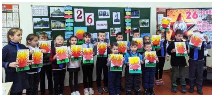
Рисунок 1. Внеклассная деятельность в начальной школе