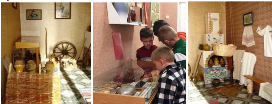
Фото 6. Школьный историко-краеведческий музей

Также в школе организован историко-краеведческий музей, в котором сейчас шесть действующих экспозиций: «Великая Отечественная война советского народа», «Моей школе - шестьдесят», «Культура и быт белорусского народа», «Деньги», «Документы прошлых лет», «Древний Пинск, ты всегда молодой!» и «Геноцид белорусского народа». Основные направления работы музея - это сбор и систематизация материалов, комплектование фондов, проведение экскурсии и презентаций. Музейные предметы являются главными носителями социальной, исторической и культурной информации; краеведческий материал помогает воспринимать процесс становления и развития национальной культуры, позволяет через единичное увидеть общее.