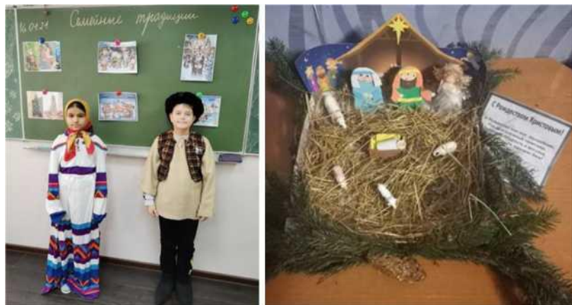
Фото 4, 5. Занятие «Семейные традиции»

Прикосновение к истории своей семьи вызывает у ребенка сильные эмоции, заставляет сопереживать, внимательно относиться к памяти прошлого, к своим историческим корням. Занятия по интересам «Моя семья» способствуют бережному отношению к традициям, сохранению семейных связей.