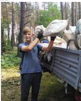
Фото 8. Уборка лесопарка