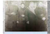
Фото 4 - Фрагмент презентации «Праведники народов мира Новогрудчины»

Записали видеоинтервью о людях, которые были детьми во время Великой Отечественной войны, находили истории детей и подростков нашего района, которые сражались наравне с взрослыми в партизанских отрядах, были связными, детьми полка. Приняли участие в создании видео - сюжета о подвиге героя - земляка, подготовили фото и видео материалы о событиях, происходивших на территории района в военное время. Создали буктрейлер на книгу "Память" Новогрудского района, сняли видеоклип на музыкальное произведение. Создавали электронные плакаты-газеты в сервисе WikiWall «Мы - наследники Великой Победы», одержали победу в областной викторине по Великой Отечественной войне.