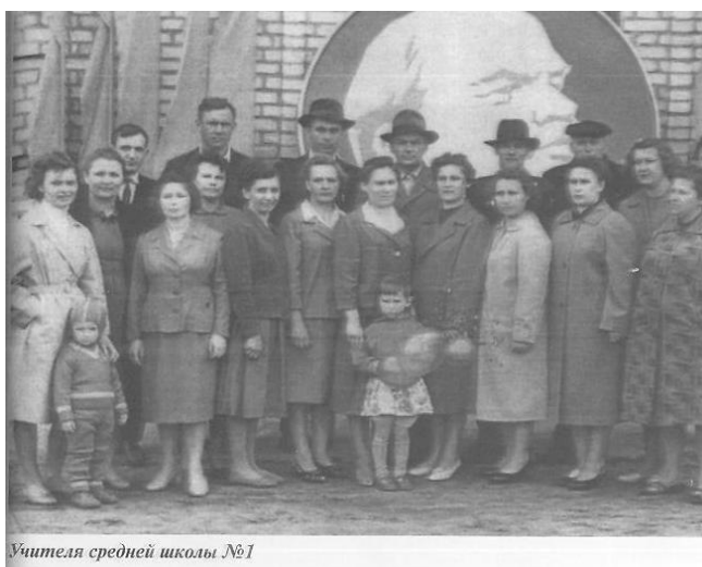
Учителя средней школы №1

Школе удалось воспитать своих выпускников целеустремленными, активными, любознательными, отзывчивыми и добрыми, каждый из них сможет найти достойное место в жизни. Нашей школе исполнилось пол века. В ней учились родители нынешних учеников. Но ведь кто-то стоял у самых истоков кто-то тогда открыл ее. И затем несколько поколений учителей работали здесь. Все они были непохожими друг на друга, как вообще каждый из живущих на Земле людей. И все в разное время несли детям свет и радость познания. Восстановлению полувековой летописи много помогли ветераны труда. Воспоминания пожилых людей могут быть отрывочными, порой даже противоречить друг другу. Но от этого они не становятся менее ценными для нас. По ним полнее представляем, чем жила школа в те времена.