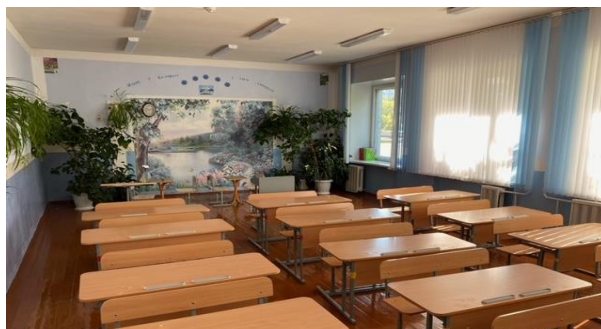
Кабинет начальных классов