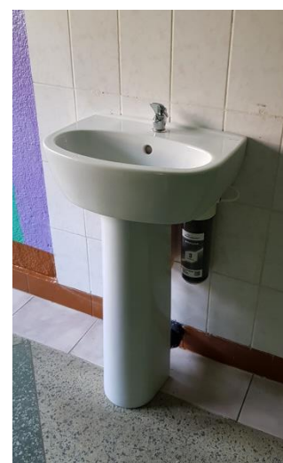
Установка питьевых фонтанчиков

Реставрация школьной мебели силами учащихся через реализацию проекта вторичной занятости: