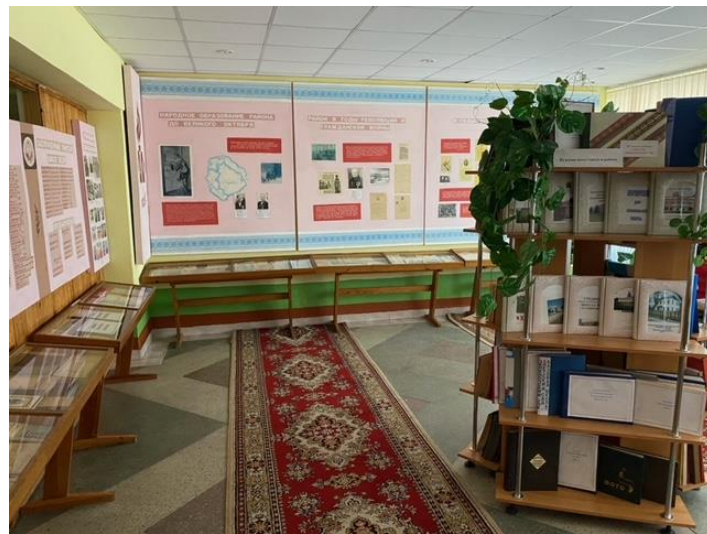
Музей народного образования