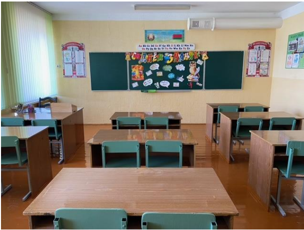
Кабинет английского языка