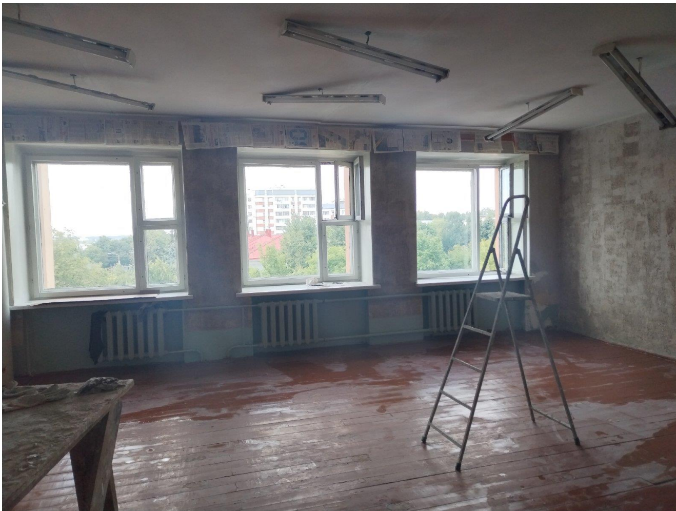
Ремонт библиотеки. Было.