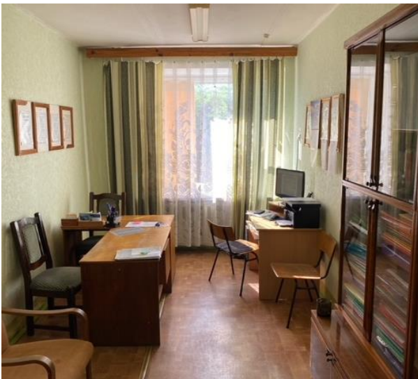
Кабинет педагога социального