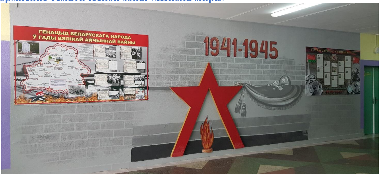
Оформление зоны «Геноцид белорусского народа в года ВОВ»