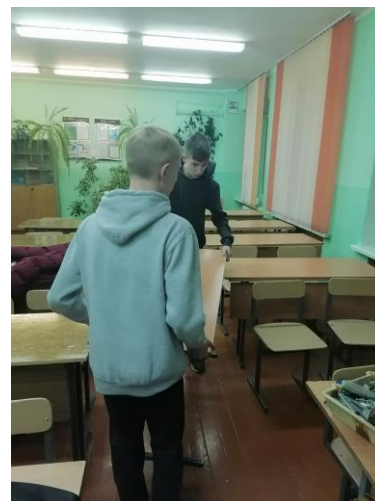
Ремонт ученических столов