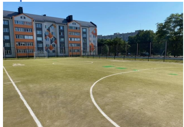
Спортплощадка с иск. покрытием