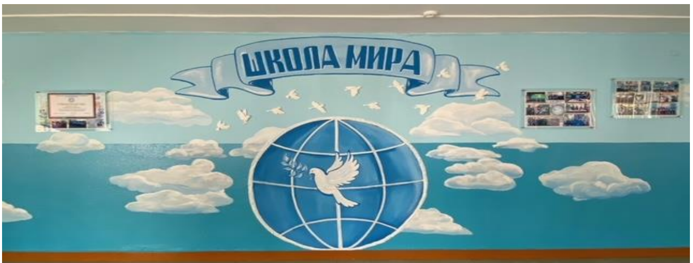
Оформление тематической зоны «Школа мира»