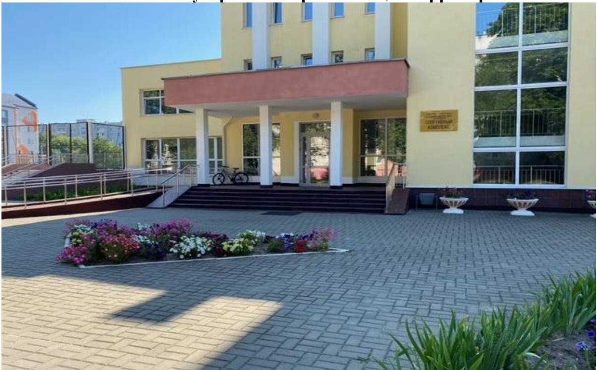
Благоустройство прилегающей территории