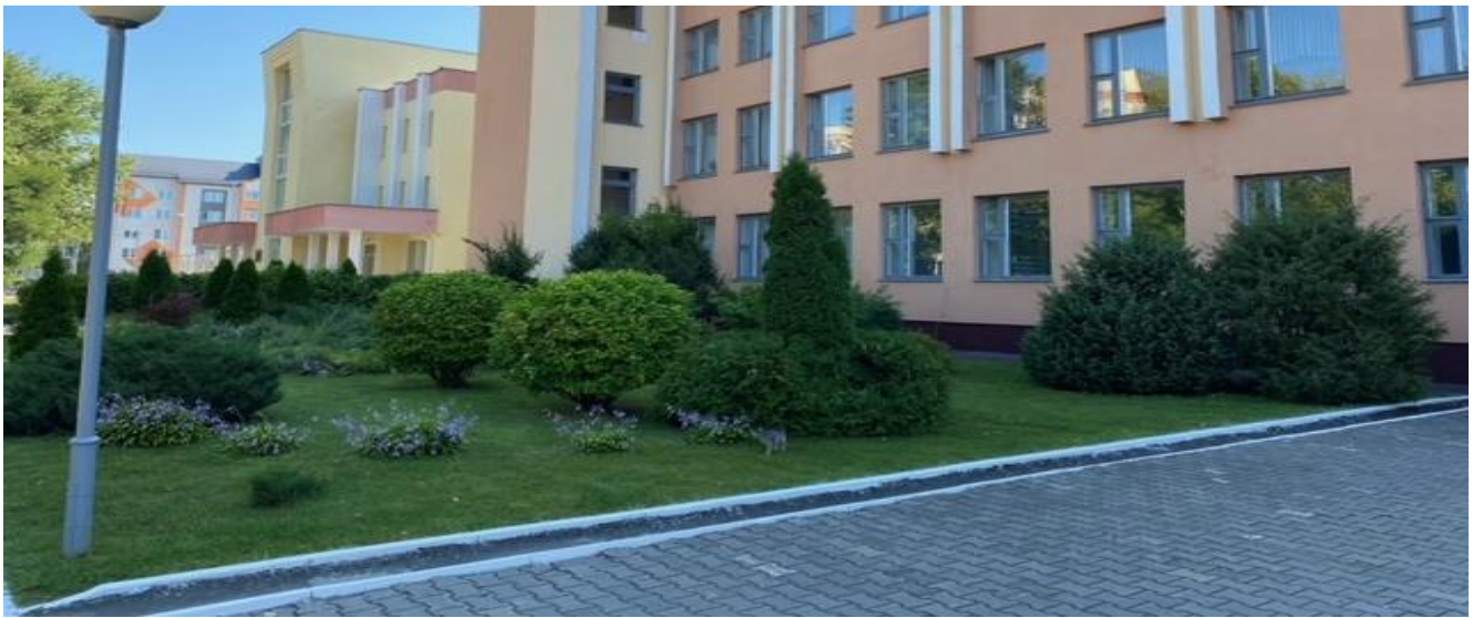
Благоустройство прилегающей территории