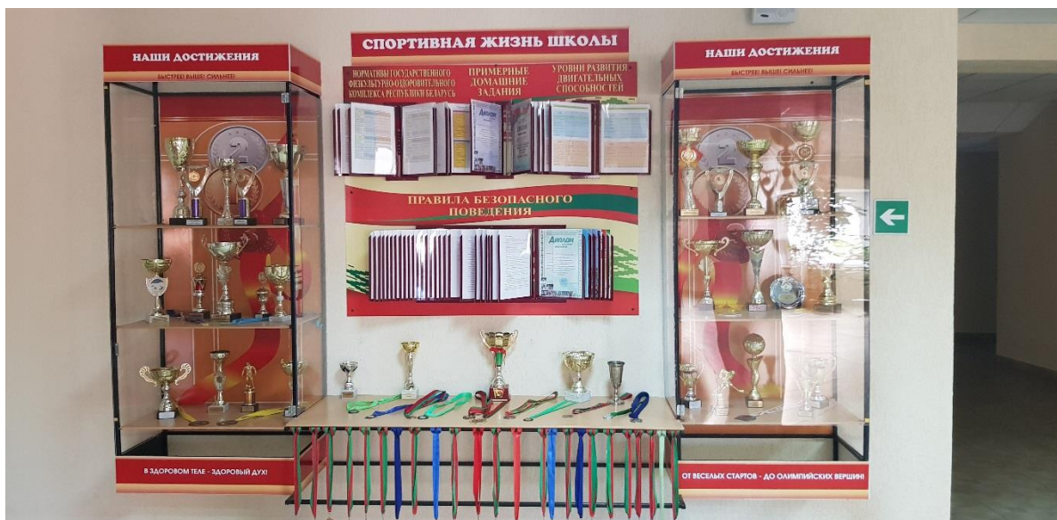
Информационное пространство. Стенд «Спортивная жизнь школы»