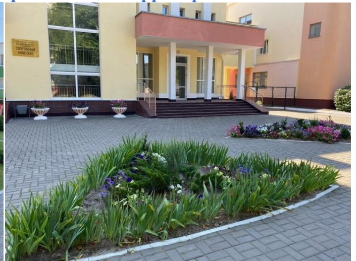
Благоустройство прилегающей территории