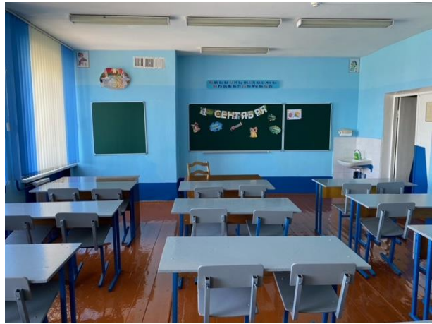
Кабинет английского языка