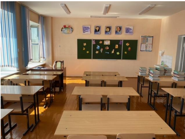
Кабинет белорусского языка