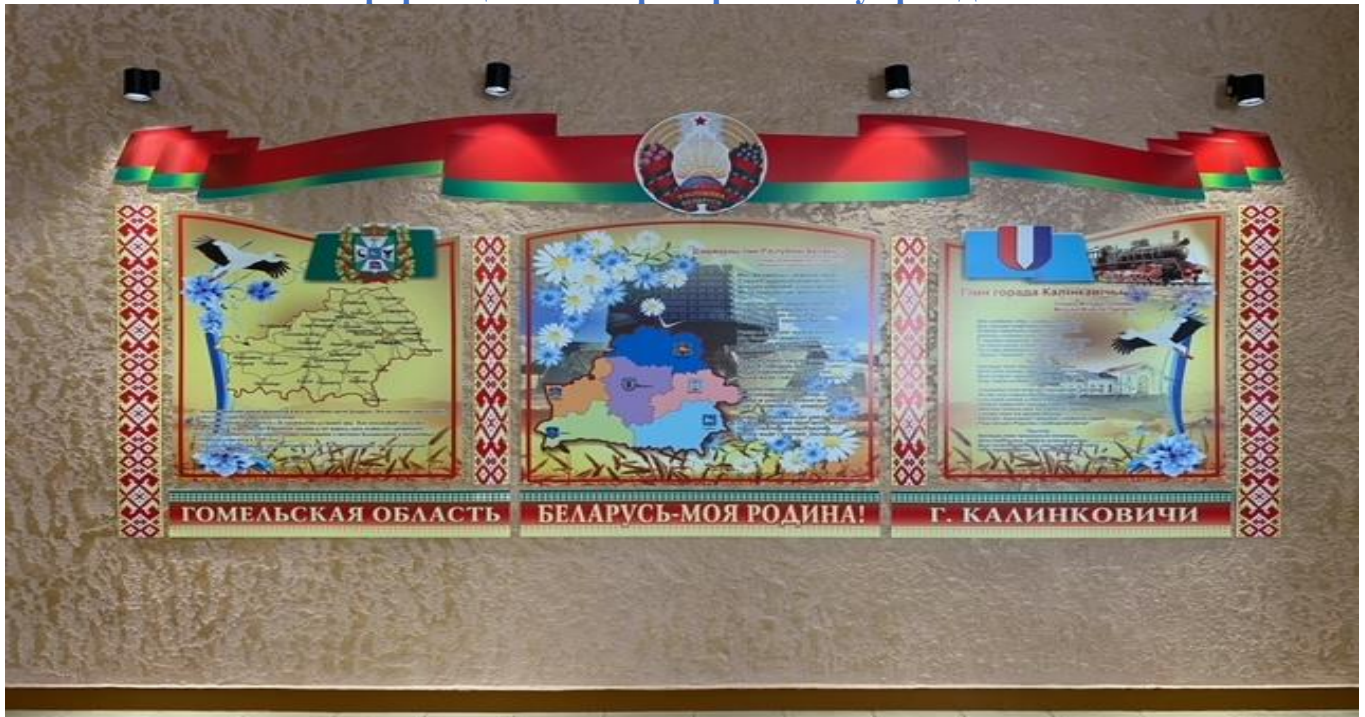
Оформление тематической зоны государственной символики