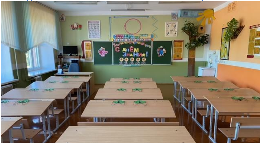
Кабинет начальных классов