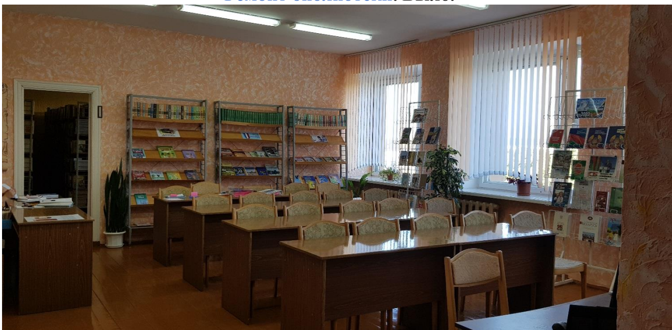
Обновлённый вид библиотеки