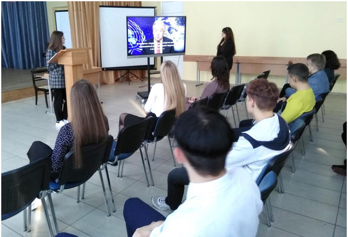
Просмотр видеосюжета «Инициативы ООН в аспекте решения экологических проблем»