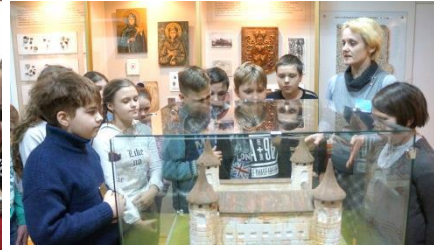
Знакомство с историей г.Ивье в единственном в Беларуси музее национальных культур