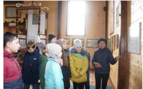
Знакомство с историей татар прошла в мечети. Этот храм не был закрыта даже в годы атеизма