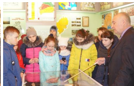
На экскурсии в Бердовском историко-краеведческом народном музее

На весенних каникулах учащиеся 5-6 классов вместе с классными руководителями Н.Н.Анашкевич и И.В.Остроух отправились на экскурсию в соседний районный центр, город Ивье.