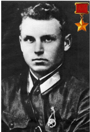
Александр Константинович Горовец

Войсковыми соединениями командовали 217 генералов и адмиралов — белорусов.