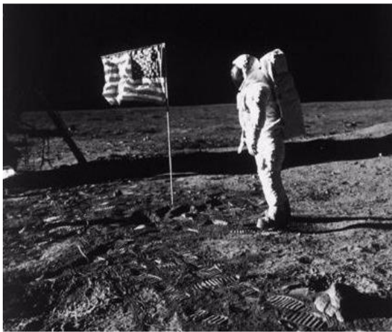
The American flag is placed on the moon

American astronaut Neil Armstrong has become the first person to step on the surface of the moon.