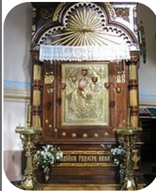
6. Казанская (Гродненская)