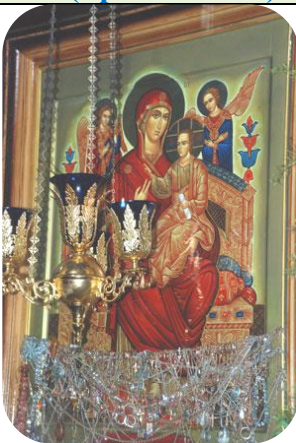
8. Всецарица (Сынковичи)