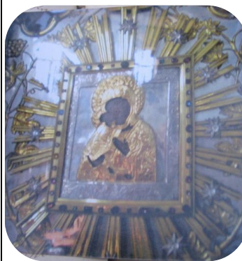
9. Голдовская (Владимирская)