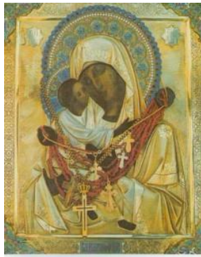
5. Владимирская (Гродненская)