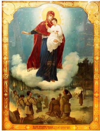
1. Августово явление