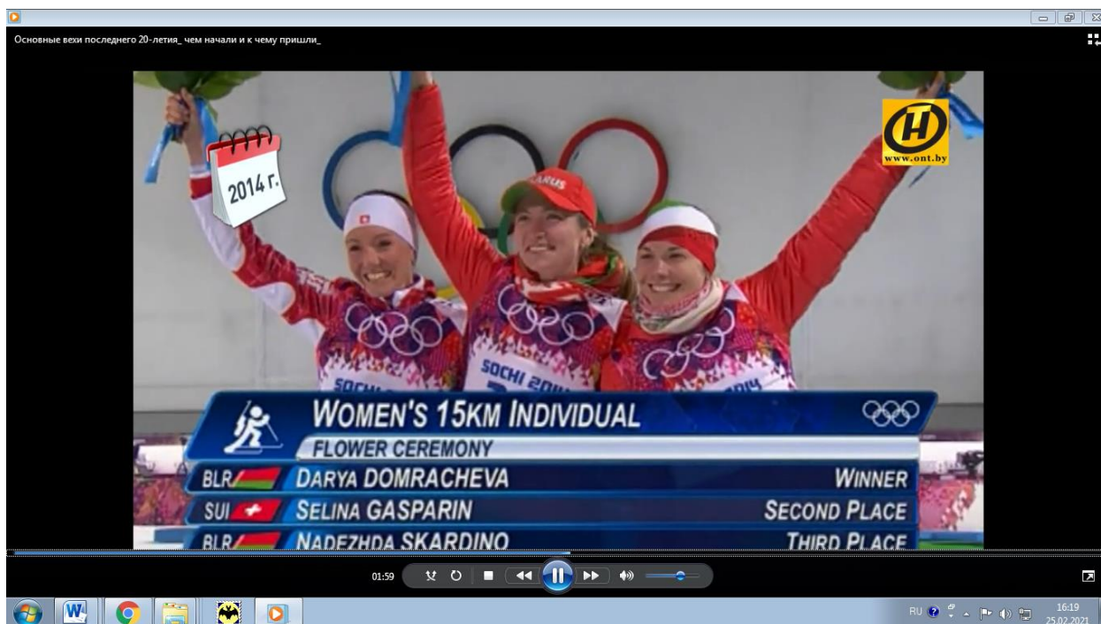
Скриншот видеоролика «Основные вехи последнего 20-летия»