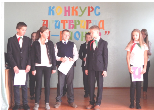
Пионерский отряд им. Марата Казея