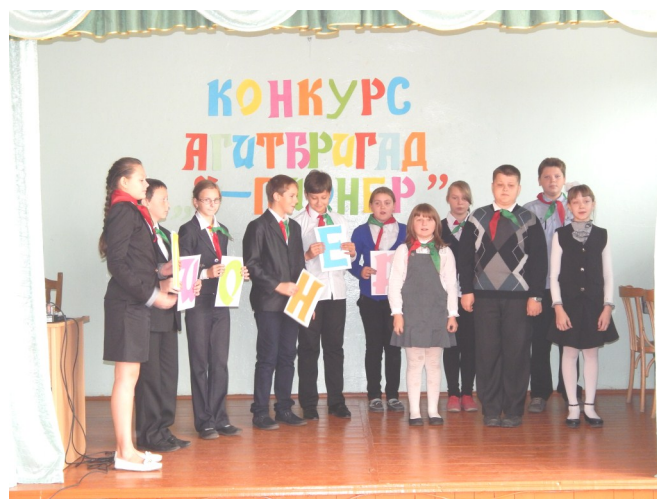
Победитель—пионерский отряд им. Лиды Вашкевич

Каждый отряд использовал пионерскую атрибутику, представил название своего отряда, девиз и речёвку. Напомнили отряды и об основных обязанностях пионеров, вспом-