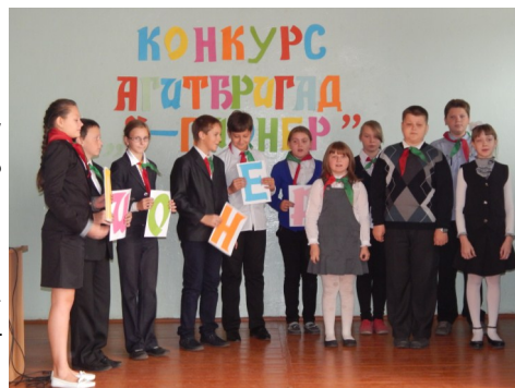
Пионерский отряд им. Лиды Вашкевич

Первое место в конкурсе заняла агитбригада пионерского отряда им. Лидии Вашкевич, второе место - пионерский отряд им. Марата Казея, 3-е место - пионерский отряд им. Володи Дубинина.