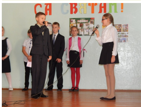
Ученики 5 «А» класса

Мы живём посредине народов, И с соседями всеми на «Вы»: Такова белоруса природа, Белорусы во всём таковы.