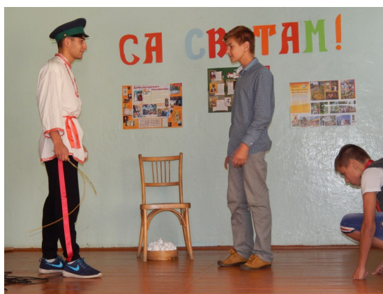
Ученики 10 класса. Сказка «Мужык і жонка»