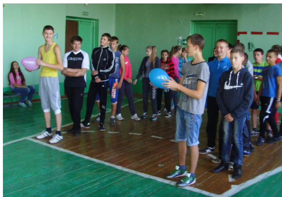
Ученики 8-9 классов участвуют в эстафете. Конкурс «Воздушный шарик»

В целях формирования ЗОЖ, укрепления уверенности детей в своих силах и знаниях, воспитания интереса к участию в спортивно-массовых мероприятиях, воспитания любви к спорту 13 сентября в ГУО «СШ № 2» проводился День здоровья.