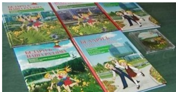
Подарок Президента Республики Беларусь А.Г. Лукашенко