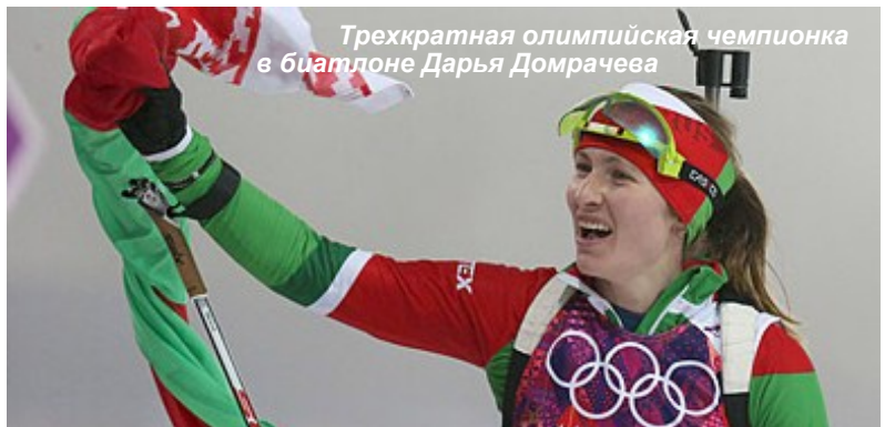
Трехкратная олимпийская чемпионка в биатлоне Дарья Домрачева

Первую золотую медаль в копилку сборной Беларуси завоевала Дарья Домрачева .