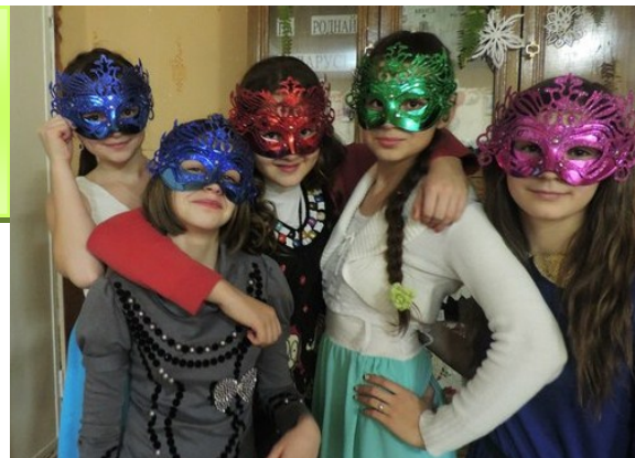
Учащиеся 8 «Б» класса перед балом

На новогоднем представлении ребята встретились с Дедом Морозом и его внучкой Снегурочкой. Дети порадовали их своими стишками и песнями, они водили хоромы вокруг ёлки, танцевали, играли вместе со сказочными героями. С удовольствием помогли в про-