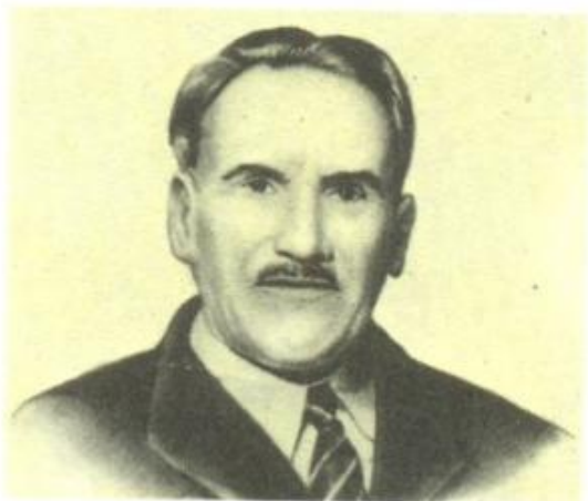
М. С. Арэхва.

Мікалай Сямёнавіч Арэхва (11 (24) лістапада 1902, в. Баруны Ашмянскага павета Віленскай губерні, цяпер Ашмянскі раён Гродзенскай вобласці — 16 ліпеня 1990, Мінск; парт. псеўд.: Пётр, Клышка-Маліноўскі, Мікуліч, Барысевіч) — дзеяч рэвалюцыйнага руху ў Заходняй Беларусі, гісторык.