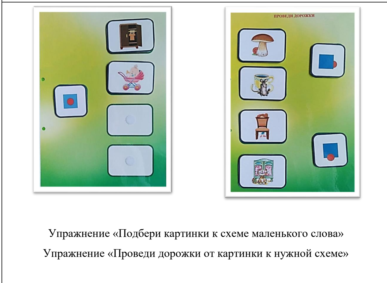
Упражнение «Подбери картинку к схеме маленького слова» Упражнение «Проведи дорожки от картинки к нужной схеме»