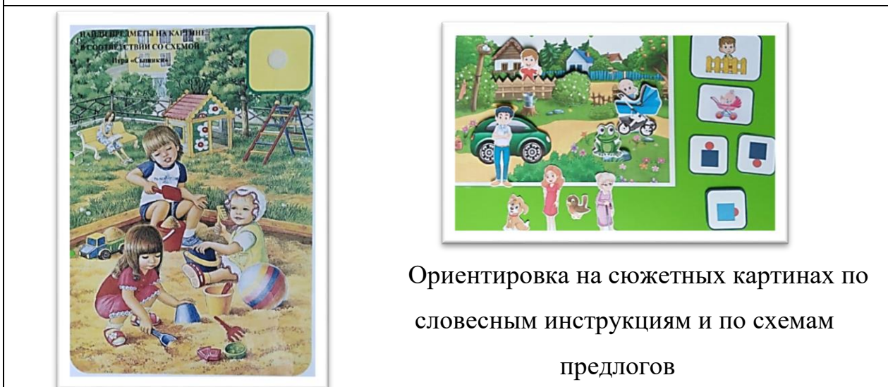
Ориентировка на сюжетных картинах по словесным инструкциям и по схемам предлогов