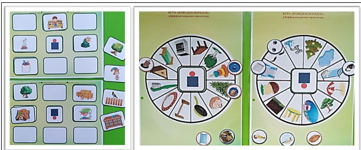
Игры на дифференциацию предлогов «Наведем порядок»