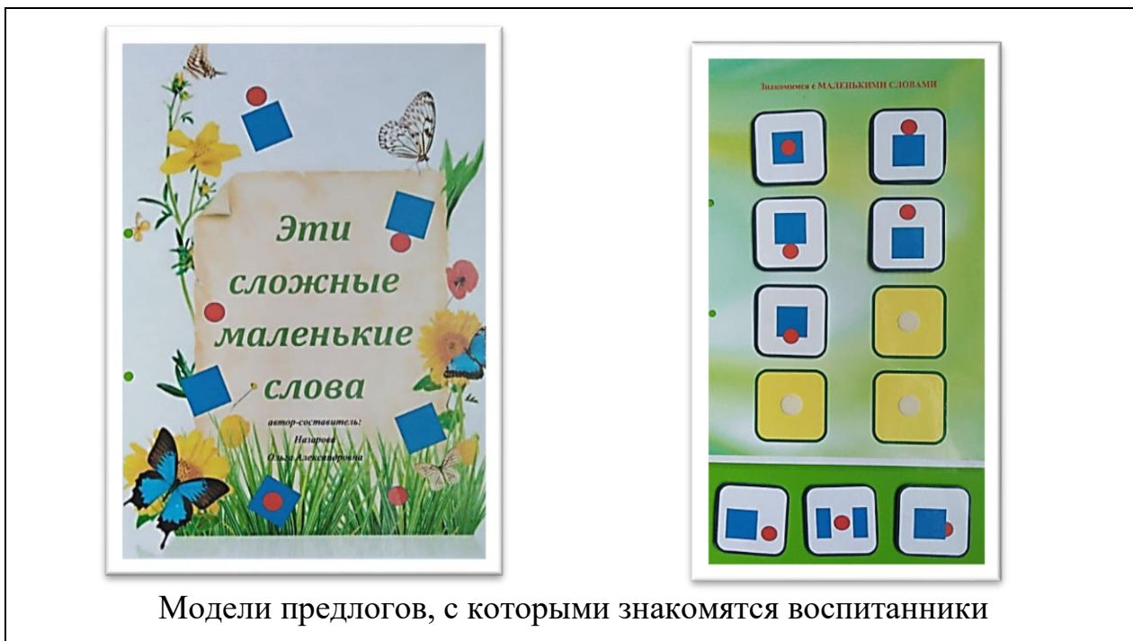
Модели предлогов, с которыми знакомятся воспитанники