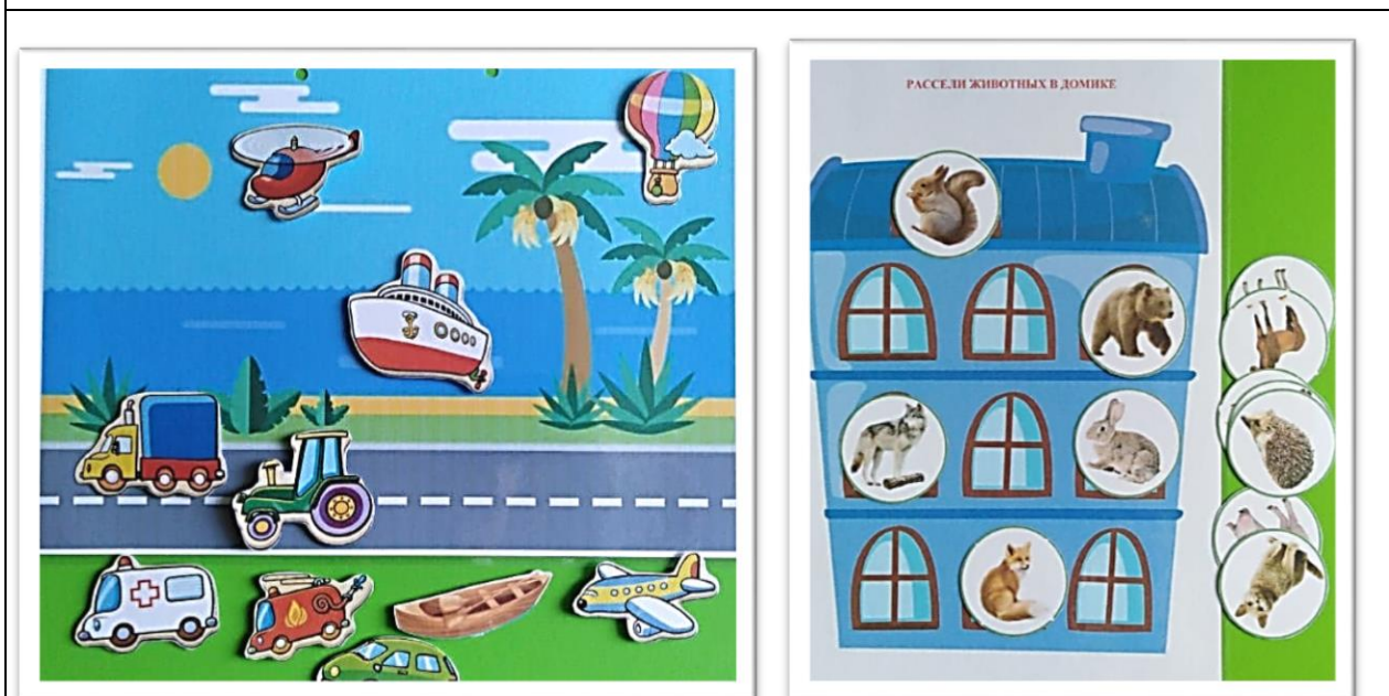
Игры на раскладывание изображений по словесным инструкциям или по схемам предлогов