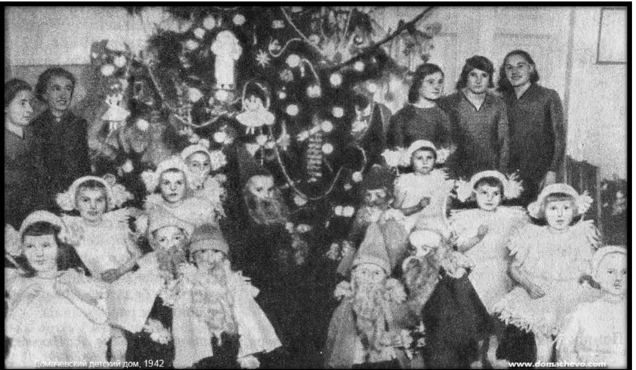
Домачевский детский дом, 1942